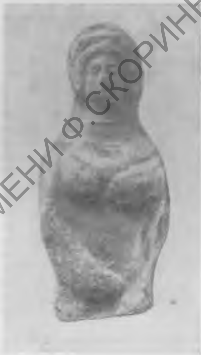
Рис. 4. Терракотовая фигурка парфянского времени

женных бугров в северо-восточных и юго-восточных углах городища явно намечаются руины других обширных зданий, причем прослеживаются не только кладки стен из парфянского кирпича, но и своды. Все это многообещающие объекты для будущих раскопок.