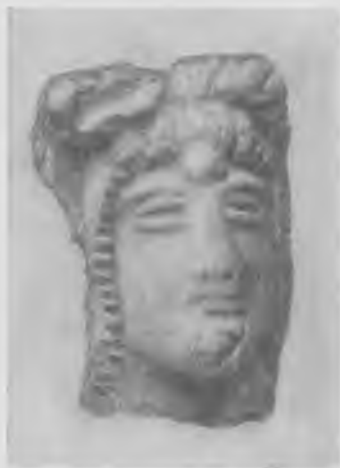
Рис. 5. Терракотовая головка парфянского времени

Среди полученного на Гяур-кале материала парфянского времени совершенно особое значение имеют первые археологические комплексы керамической утвари, датируемые арсакидскими монетами пока преимущественно первых веков нашей эры. Интересны амфоры, энохи, изящные кувшинчики, чаши. Мерв дал также фрагменты керамических ритонов, употреблявшихся в быту и близких к тохаристанским с правобережья Аму-Дарья, которые принадлежат кушанскому времени. Носик одного мервского ритона изображает голову быка. Собраны десятки фигурок терракотовой народной скульптуры, изображающих преимущественно богини и жрицы, то обнаженных, то полуобнаженных, то задрапированных в длинные одежды с высокими тюрбанобразными головными уборами и зеркалом в руке. Как и в парфянских слоях Нисы, в Мерве в изобилии попадаются морские раковины из Индийского океана (мелких «каури», больших «тритонов», крупных устриц и др.), указывающих на наличие определенных связей Маргианы со странами Индии.