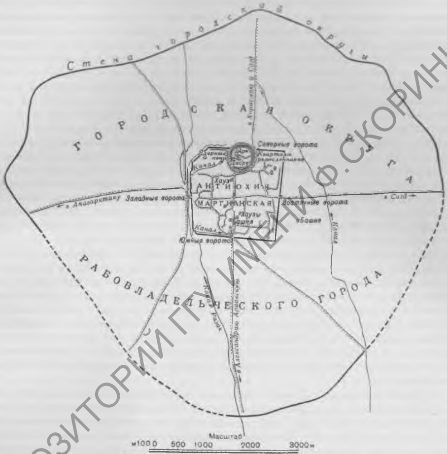
Рис. 1. Мерв парфянского времени

Султан-кала с Шахриярарком и Искандер-калой, Абдулла-хан-кала с Байрам-Али-хан-калой; при этом производилась регистрация материалов по крупным квадратам и составление археолого-топографических планов. В Эрк-кале и Гяур-кале осуществлены два раскопа и два стратиграфических шурфа. Небольшой разведочный раскоп заложен к югу от Султан-кала. Проведено несколько маршрутных выездов в северном, северо-западном и южном направлениях от Старого Мерва. Седьмой отряд занимался