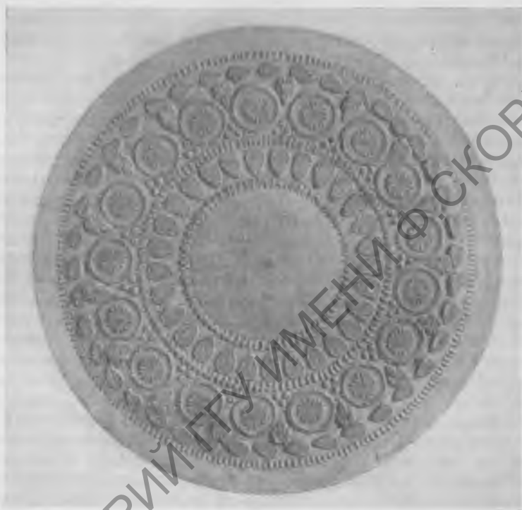
Рис. 2. Оттиск с терракотовой матрицы из Гяур-калы

Обследование стен Гяур-калы показало, что она строилась в несколько приемов (причем применялись различные типы кладки) и нередко ремонтировалась. К эпохе Антиоха следует, повидимому, относить выведение на остатках старых глинобитных стен, использованных как пахсовое основание, новых стен из сырцового кирпича (размером 40 \times 40 \times 12 см). Многочисленные прямоугольные башни, из которых сохрани-