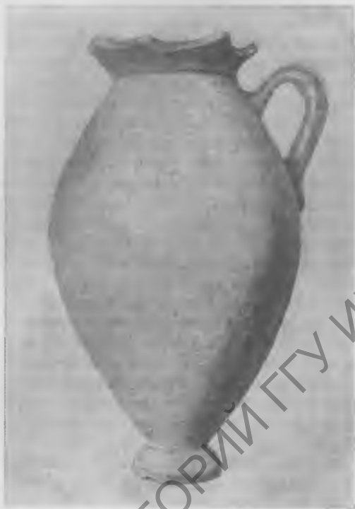
Рис. 3. Парфянский сосуд из раскопа «дома медных дел мастера»

ные магистрали, отходившие от четырех ворот и рассекавшие весь город на четыре части. Более плотно была заселена широкая полоса средней части города между восточными и западными воротами, а также кварталы по обе стороны улицы, шедшей от центра к южным воротам. Здесь мощность культурных наслоений достигает 7 и более метров, причем значительная часть нижних ярусов приходится на парфянское время. Большая разреженность наблюдается во всех четырех углах Гяур-калы. Характерно, что здесь «парфянский материал» в виде монет и керамики выходит прямо на поверхность и не перекрыт более поздними отложениями; это показывает, что Гяур-кала полностью была обжита в пору расцвета рабовладельческого общества. Среди отдельно распо-