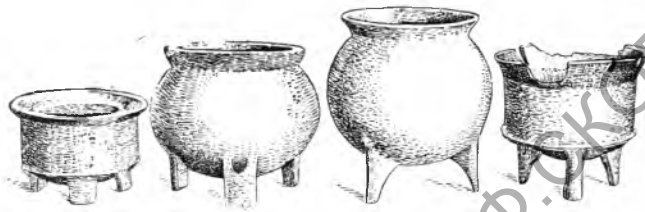
Рис. 4. Со-уды «ши» из Цинтай

Еще ниже расположен третий слой, резко ограниченный от второго. На одном из участков третьего слоя были найдены следы очага. Здесь цвет земли во многих местах черный и много крупных, обожженных до-красна, кусков земли. Накопления остатков очага имеют форму круга, диаметром приблизительно в 4 м. Извлеченные из земли сосуды сделаны главным образом из серо-черной глины, однако встречается черная керамика луншаньского типа. Кроме того, найдены ножи и пилы из ракушек, каменные орудия, распиленные кости и трехгранный костяной наконечник стрелы. Па