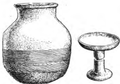
Рис. 2. Сосуд с шнуровым орнаментом из Дяньцзюньтай

Чжэнчжоу). Эту работу было поручено провести археологам Ань Чжи-миню, Ван Чжун-шу, Ма Дэ-чжи и Ся Най. Произведенные ими в этом районе в апреле 1951 г. раскопки 1 заставили их усомниться в вышеупомянутой схеме. Тогда они решили произвести раскопки в самом селе Яншао, по которому названа культура расписной керамики. Результаты этих раскопок 2 подтвердили, что, по крайней мере в некоторых местах, остатки яншаоской культуры сочетались с остатками луншаньской культуры, образуя как бы одну смешанную яншаоско-луншаньскую культуру.