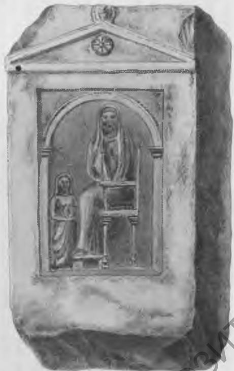
Рис. 8. Стела из усадьбы Дубовичной