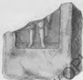
Рис. 11. Стела, изображающая юного воина