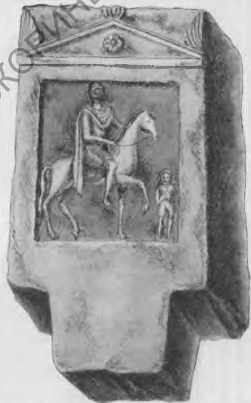
Рис. 10. Стела, найденная гр. Мыслимым