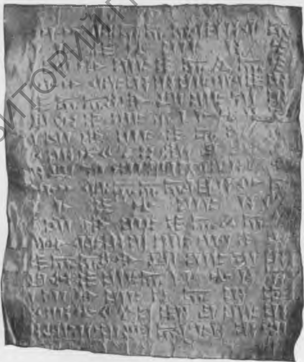
Фото 22. Надпись № 105. Эстампаж музея Грузии.