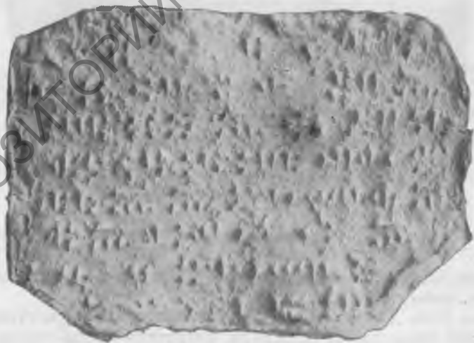
Фото 8. Надпись № 37. Верхняя сторона. Эстампаж музея Грузии

Зивин (селение, расположенное в районе Эрзерума). Надпись 8 на каменной плите; сохранились две части этой надписи. Камень имел, очевидно, форму большой