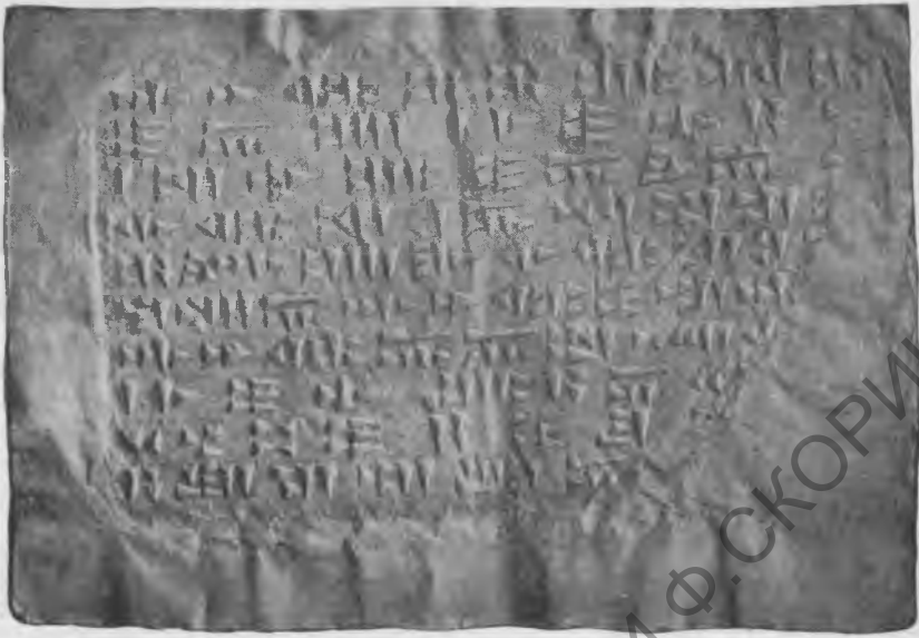
Фото 17. Надпись № 66. Эстампаж музея Грузии