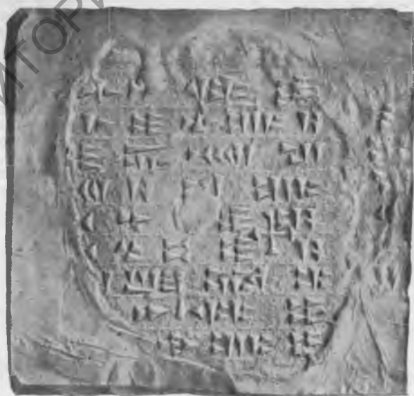
Фото 19. Надпись № 72. Правая сторона. Эстампаж музея Грузии

1 [ D hal]-di-i-ni-ni us-ma-a-si-i-ni [ D hal]-di-e e-ú-ri]-e [ I me-i-nu-ú-a-se I is-pu-ú-i-ni-e-hi-i-ni-e-se i-ni su-si-e si-di-is-tú-ú-ni É.GAL si-di-is-tú-ú-ni ba-a-du-ú-si-i-e I me-nu-a-ni I is-pu-ú-i-ni-e-hé 5 [LU]GÁL tar-a-i-e LUGÁL al-a-su-ú-i-ni-e LUGÁL KUR sú-ú-ra-a-ú-e [LU]GÁL KUR bi-i-a 1 -i-na-a-ú-e LUGÁL e-ri-e-la-a-ú-e a-lu-si [ UR ]U tu-us-pa-a-pa-a-ta-ri [ D hal]-di-i-ni-ni us-ma-a-si-ni [ D hal]-di-i-e e-ú-ri-i-e [ I me-i-nu-ú-a-se [ I is]-pu-ú-i-ni-e-hi-ni-se i-ni su-si si-di-is-tú-ú-ni