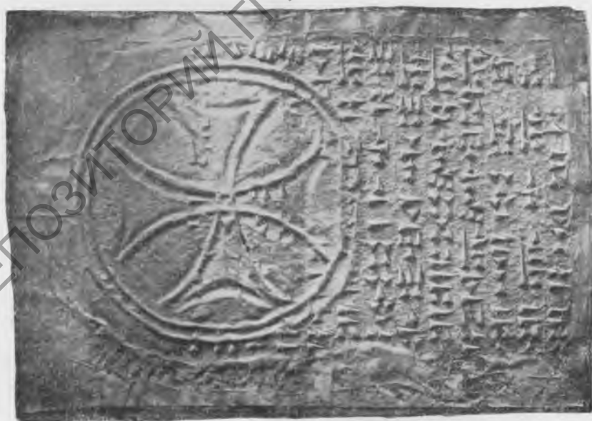
Фото 15. Надпись № 60. Эстампаж музея Грузии.