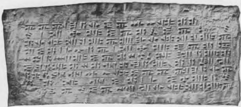
Фото 20. Надпись № 72. Левая сторона. Эстампаж музея Грузии.