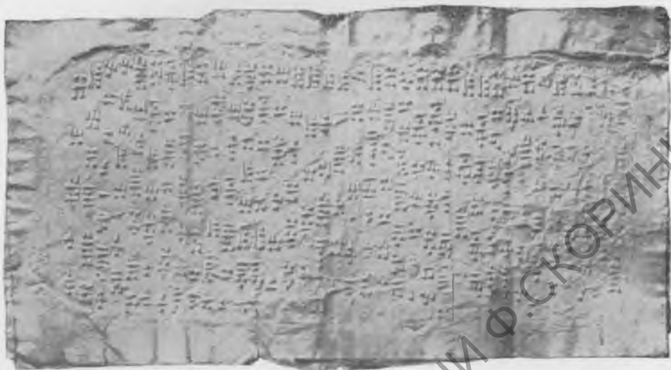
Фото 16. Надпись № 65. Эстампаж музея Грузии