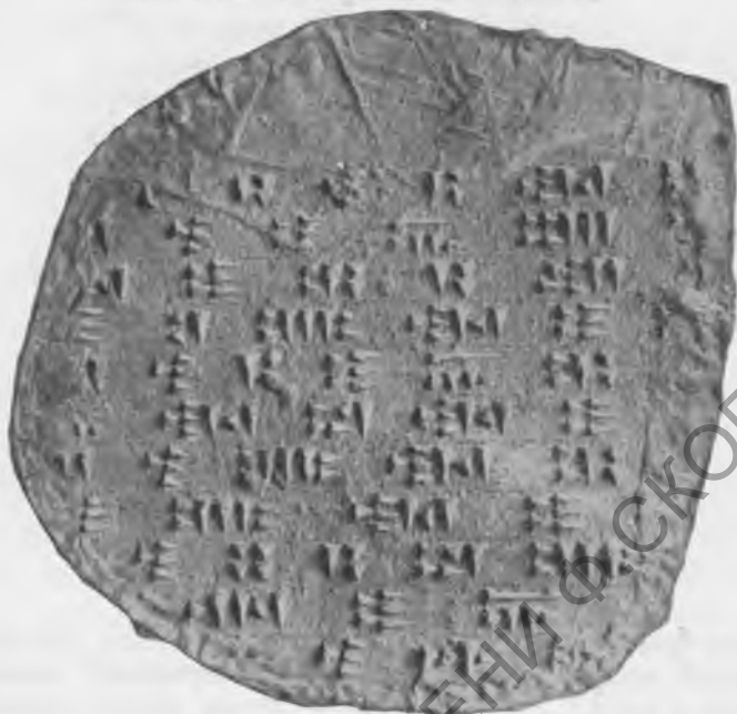
Фото 12. Надпись № 40 В. Обратная сторона. Эстампаж музея Грузии