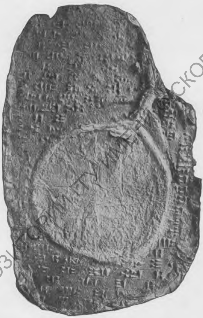
Фото 10. Надпись № 40 А. Эстампаж музея Грузии.