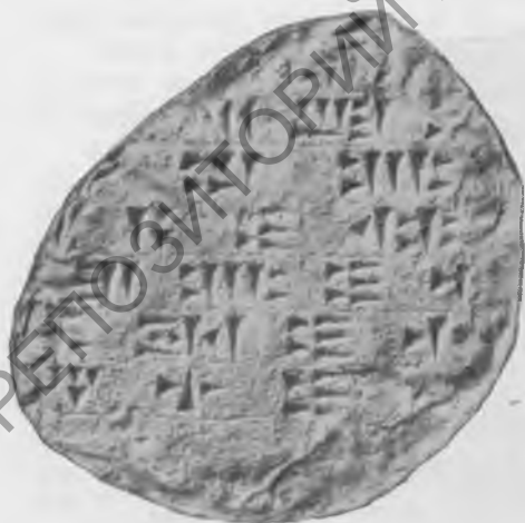
Фото 3. Надпись № 40 С. Лицевая сторона. Гипсовый слепок музея Грузии