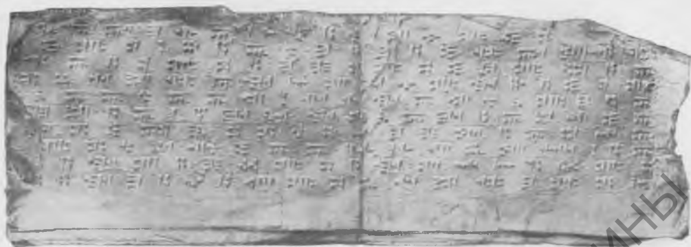
Фото 5. Надпись № 28. Лицевая сторона. Эстампаж музея Грузии (стр. 219).