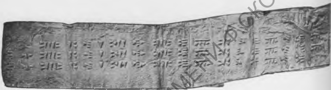
Фото 21. Надпись № 87. Эстампаж музея Грузии.