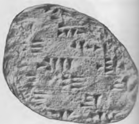
Фото 14. Надпись № 40.С. Обратная сторона. Гипсовый слепок музея Грузии