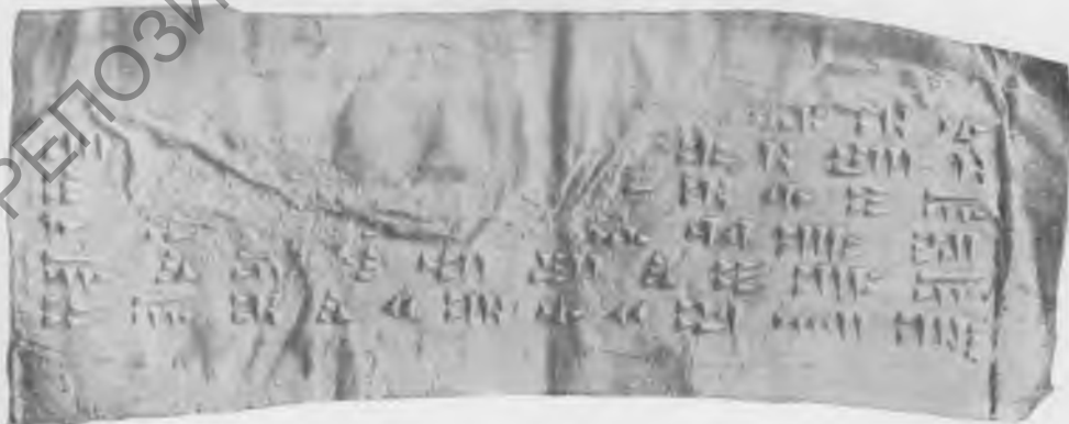
Фото 7. Надпись № 33. Эстампаж музея Грузии.