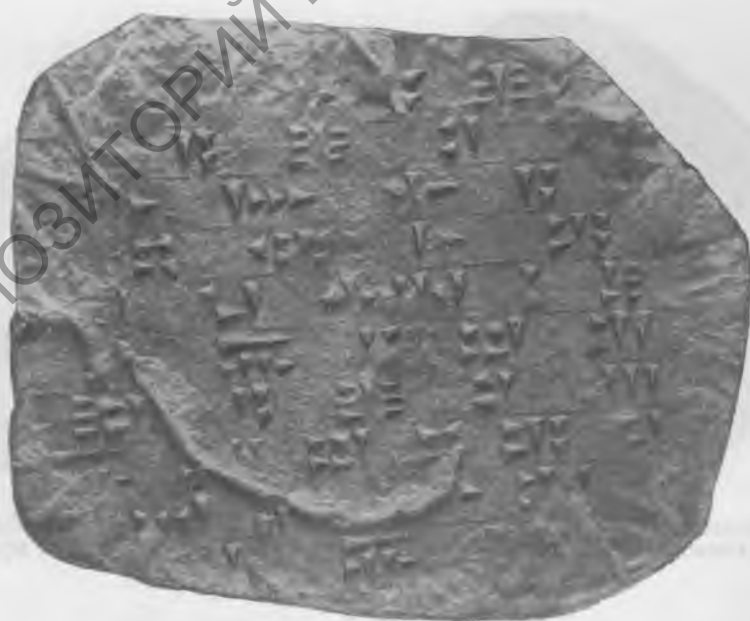
Фото 11. Надпись № 40 В. Лицевая сторона. Эстампаж музея Грузии