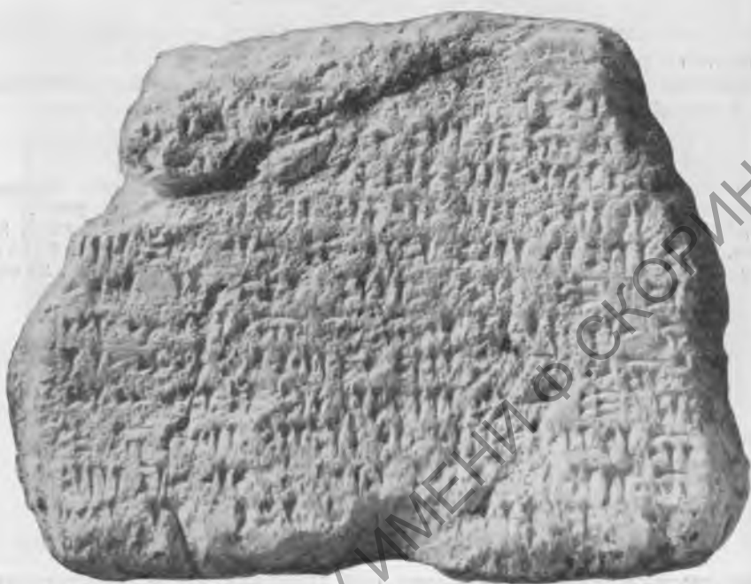
Фото 18. Надпись № 71. Передняя сторона. Гипсовый слепок музея Грузии

2 М. В. Никольский и Сэйс восстанавливают лишь: [e].