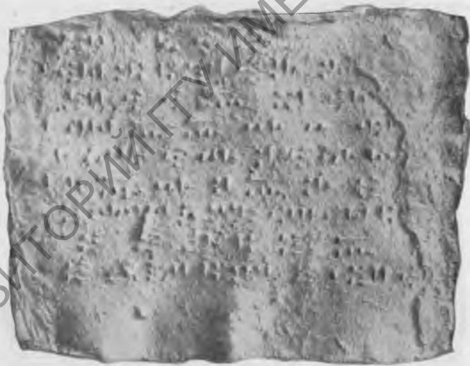
Фото 9. Надпись № 37. Нижняя сторона. Эстампаж музея Грузии

... Менуа говорит: завоевал я город Шашилу; поставил я эту надпись богу Халди, моему владыке.