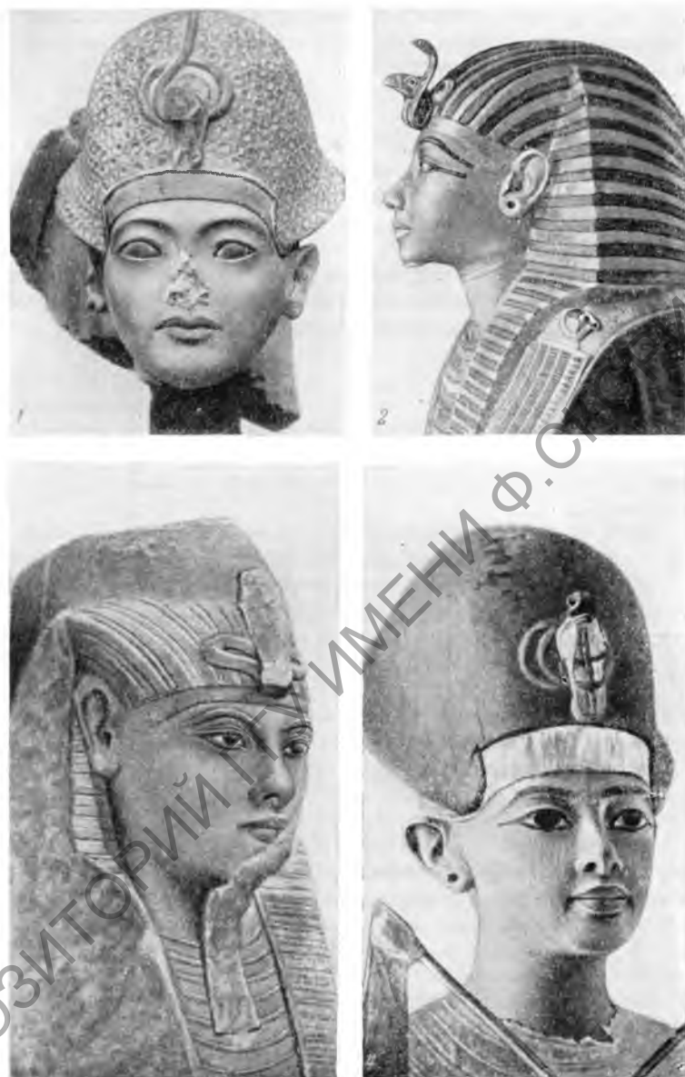
Таблица I. Портретные скульптуры фараона Тутанхамона (рис. 1—4)

женщины, принадлежавшей ко двору Эхнатона 1 . Тем самым было опровергнуто предположение некоторых авторов (Картер, Вейголл и др.) относительно юного возраста Эхнатона при его вступлении на престол и основании новой столицы. Следовательно,