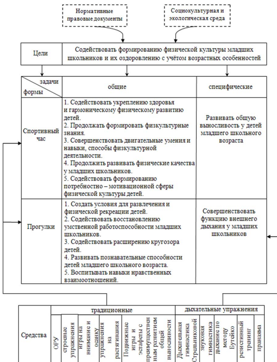
Рисунок 2 – Организационно-функциональная модель физкультурно-оздоровительных занятий с младшими школьниками в ГПД

Исходя из организационно-функциональной модели, целью физкультурно-оздоровительных занятий с младшими школьниками в группах продленного дня является содействие формированию физической культуры младших школьников и их оздоровлению с учётом возрастных особенностей.