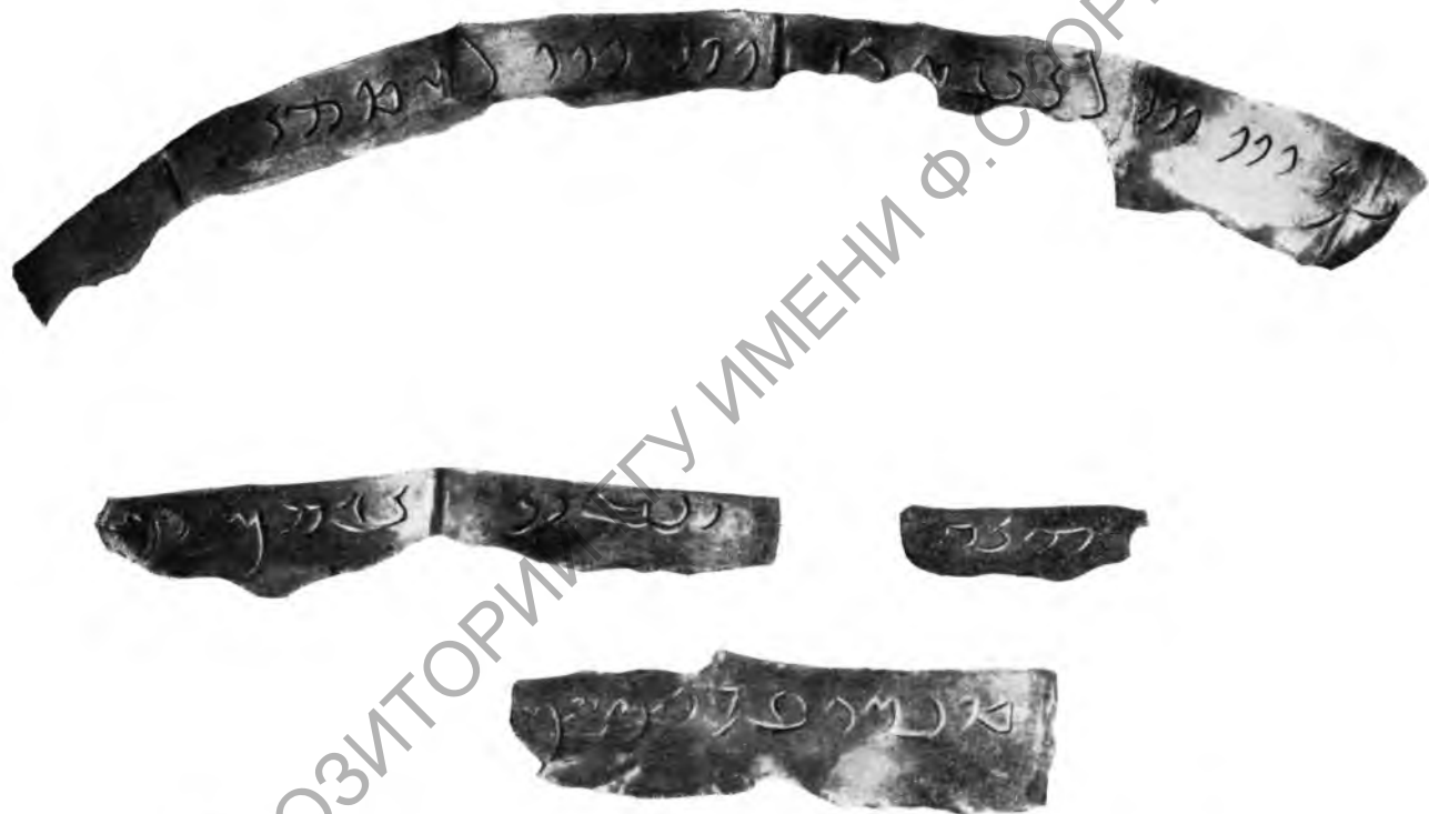
Рис. 5. Прорисовка надписи на фрагментах серебряного сосуда из Мунчак-Теле