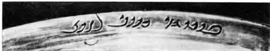
Рис. 2. Надпись на византийском блюде

С легендой бухарских монет обнаруживает большое сходство надпись на византийском блюде с изображением прихода Венеры к Анхису, найденном в 1925 г. в деревне Копчики, в 30 км от Кунгура. Это блюдо издано проф. Л. А. Мацулевичем, который датирует его по стилистическим особенностям изображений и штампам византийских мастеров серединой VI в. 1 Надпись, выполненная, по определению Л. А. Ма-