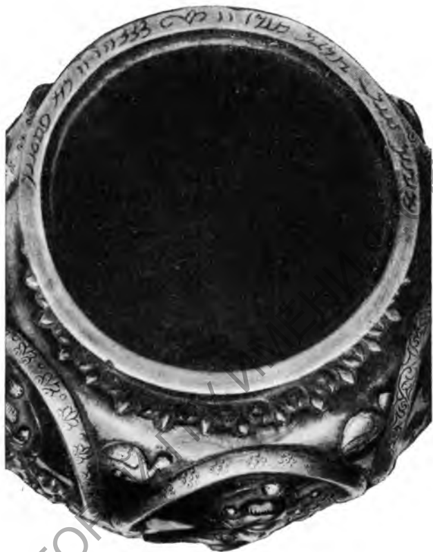
Рис. 3. Надпись на серебряном кувшинчике

Еще более интересна надпись на серебряном кувшинчике, найденном в 1926 г. на территории Молотовской области. Издатели сосуда отмечают: «На верхнем срезе венчика — ранне-пехлевийская надпись» 3 . Покойный А. Я. Борисов, отметивший