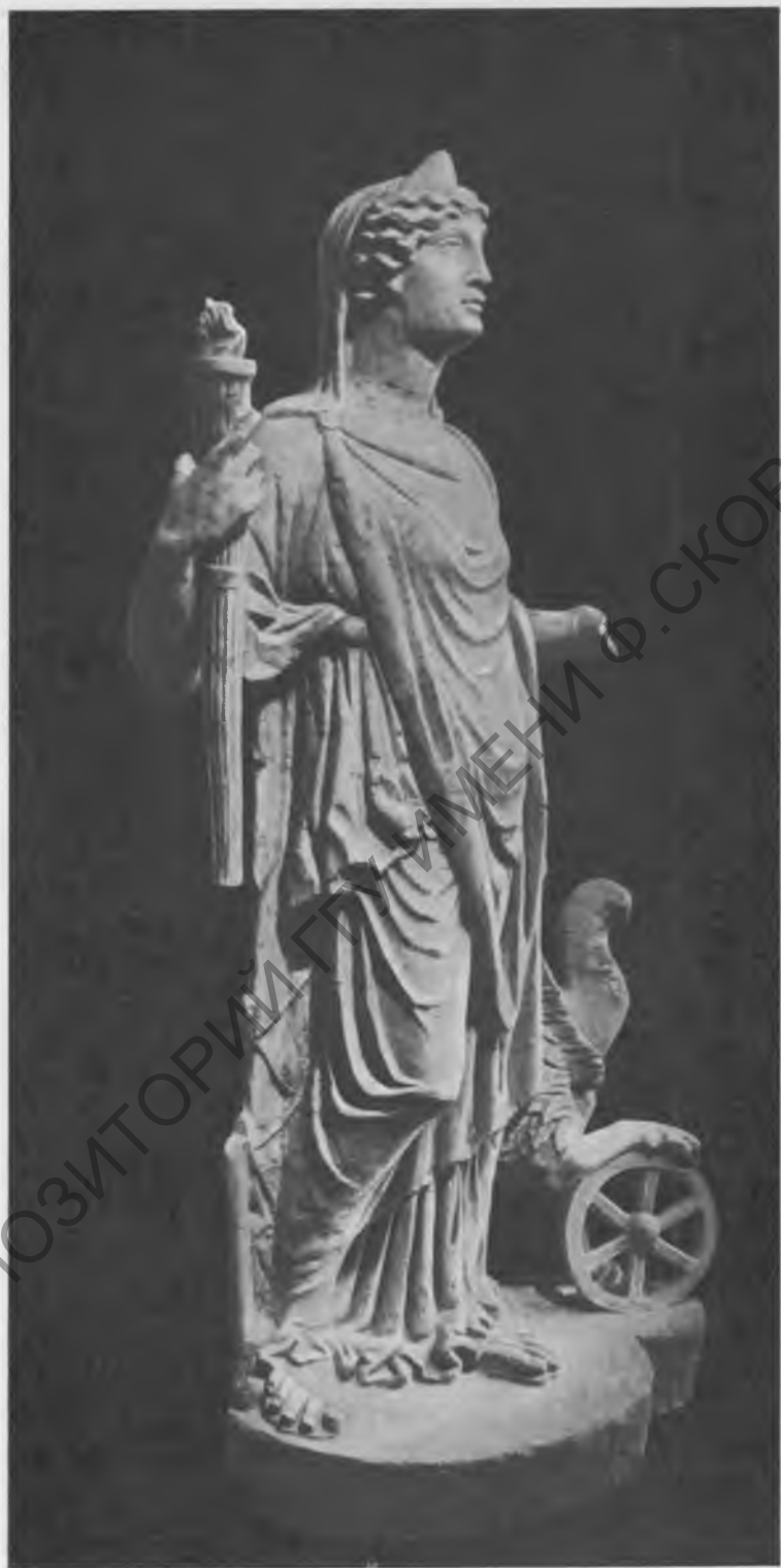
Рис. 5. Аквинкум. Статуя Немезиды (вторая половина II в. н. э.)