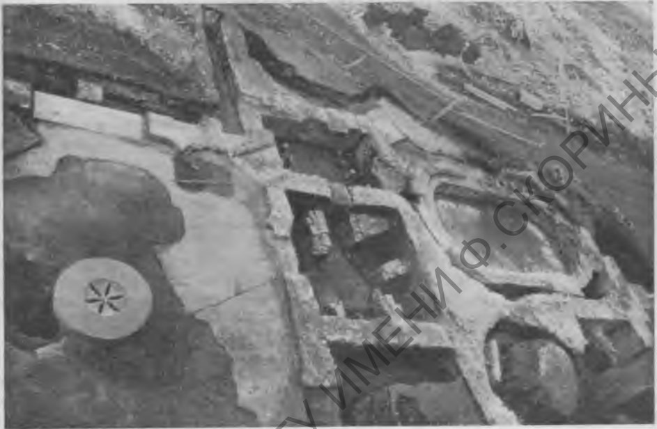
Рис. 4. Аквинкум. Остатки дворца римского наместника

В северной части Будапешта, на одном из островов Дуная в прошлом столетии при постройке судостроительного завода были обнаружены древние строительные остатки.