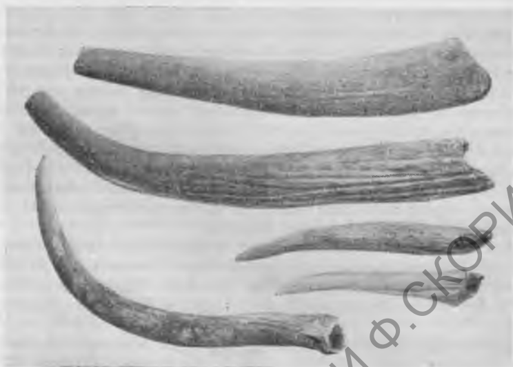
Рис. 1. Палеолитические костяные инструменты из с. Ловаш

нявшегося в качестве краски. Публикация этой находки подготавливается Д. Мехрошом и Л. Вертешем. Половина поразительно красивых костяных орудий была изготовлена из костей гигантского оленя ( Megaceros ), некоторые орудия — из костей