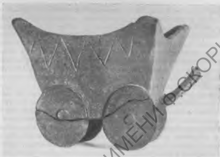
Рис 3. Глиняный сосуд в виде повозочки (Баденская культура) из Будакаласа

не исчерпано 1 . Встречаются два главных типа человеческих погребений: труположение и кремация. Особое значение имеют найденные здесь конские погребения. До сих пор было обнаружено всего 12 погребений лошадей, среди них три погребения с двумя конскими скелетами. В одном из последних были найдены железные детали повозки: обручи колёс и железные части оси. Погребения людей ни разу не были обнаружены рядом с погребением лошадей. Повидимому, трупы лошадей со сбруей хоронили обособленно на краю кладбища. На присутствие сбруи указывают найденные на конских скелетах железные удила и фалары различной величины.