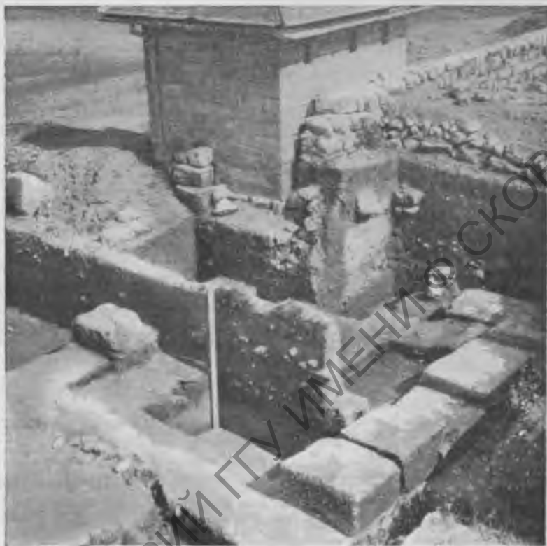
Рис. 6. Ворота римского лагеря Кампона (II в. н. э.)

Согласно письменным источникам закрепление колон 1 в дунайских провинциях произошло в период Валентиниана I. Археологический материал Интерцисы подтвер-