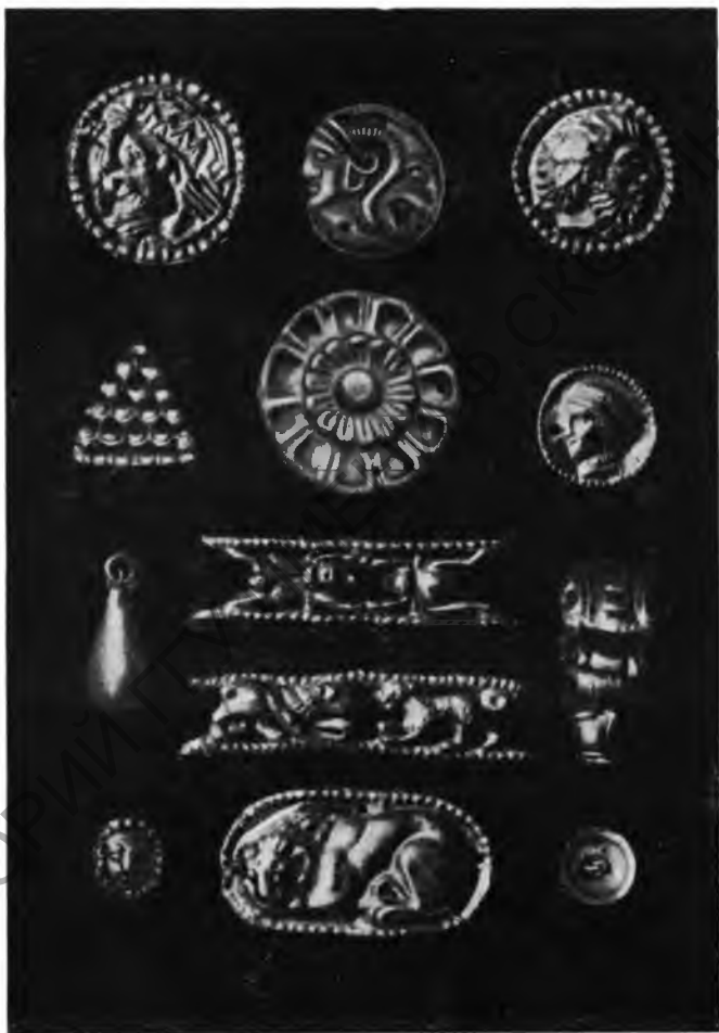
Рис. 5. Золотые бляшки из погребения скифянки