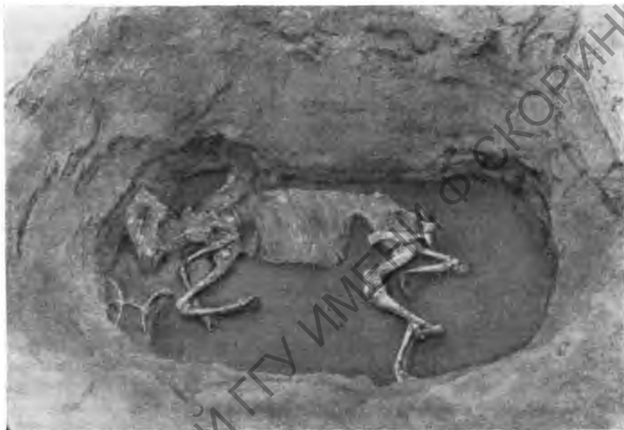
Рис. 3. Конская могила. Скелет второй лошади. В левом углу — железные удила, оставшиеся после снятия черепа первой лошади

наносники в виде рельефной головки ушастого зверя. С двух сторон черепа, вплотную к нему прилежали нащечники в виде тонких бронзовых фигурных пластинок с гравированным изображением птиц. Уздечный набор дополняли многочисленные ременные круглые бляхи разных размеров, кольца с шишечкой или с треугольной петлей, а также железное кольцо, пряжка с отростком и костяные и бронзовые мелкие ворворки. У затылочных костей черепа обеих лошадей были найдены отдельные мелкие предметы: костяные просверленные подвески, бусины, просверленный клык, которые, повидимому, были вплетены в гривы лошадей.