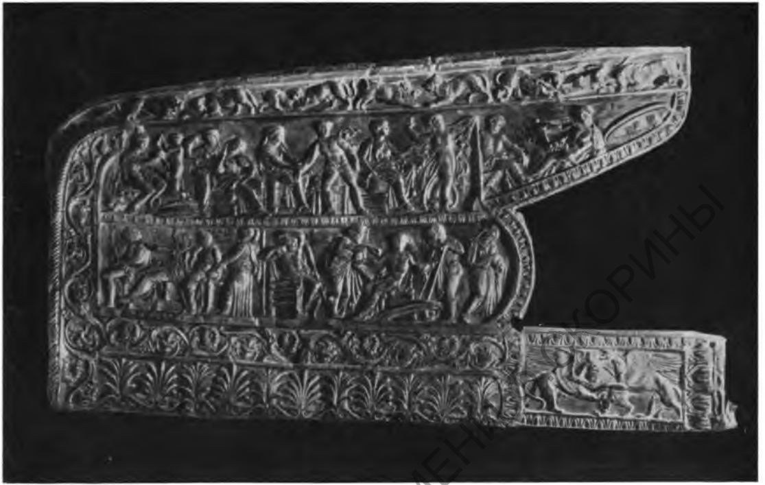
Рис. 2. Центральная могила. Золотая обкладка горита