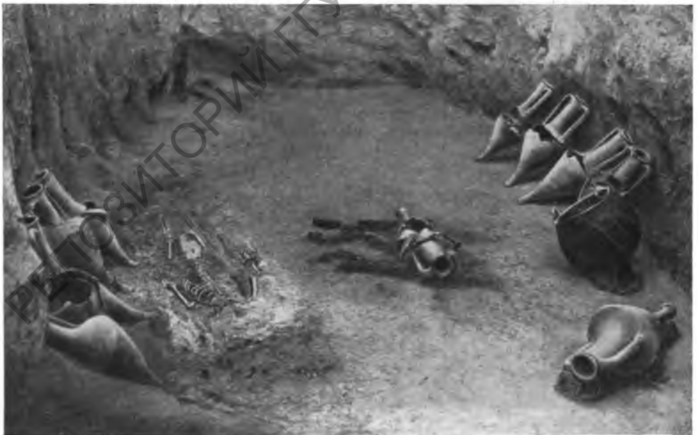
Рис. 8. Часть катакомбы с погребением рабыни и заупокойным инвентарем