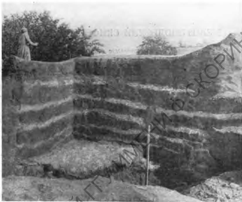
Рис. 1. Разрез насыпи кургана с прослойками морской травы и земляных вальков

Точно так же уже известен принцип устройства основной массы насыпи кургана из отдельных кусков верхнего дернового покрова земли, хорошо выделяющихся как по цвету, так и по форме в разрезе насыпи 1 . Однако кладка насыпи из специально изготовленных земляных «вальков» при раскопках стених курганов до сих пор не прослеживалась.