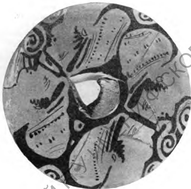
Рис. 4. Крышка леканы из женского погребения

На костях скелета и по всему дну средней части ниши разбросано было множество золотых нашивных бляшек, пронизей и бус, таких же, как и найденные выше, в перерывом грабителями слое земли над погребением. Часть из них сохранилась на месте, не потревоженной. Так, на ступнях обеих ног лежали золотые бляшки в виде звездчатых розеток, в том самом порядке, в каком они были нашиты на носки обуви (рис. 6). В области поясицы сохранилась часть пояса в виде ряда бляшек с изображением