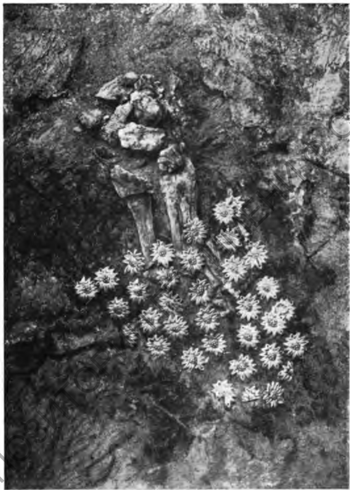
Рис. 6. Погребение скифянки. Левая нога покойной с золотыми бляшками, панцирями на носок обуви