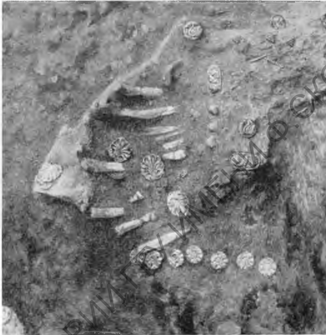
Рис. 7. Часть грудной клетки женского скелета с золотыми бляшками in situ . Ниже — ряд золотых бляшек пояса

С левой стороны скелета, на уровне грудной клетки, найдена смещенная с места костяная поделка в виде длинного стержня, с орнаментированным резьбой, заостренным нижним концом. Тут же лежал венчик небольшого металлического сосуда (серебро?) и металлическая ручка плоского сосуда. Повидимому, в пределах гробовища возле погребенной стояли и упомянутые выше чернолаковые сосуды, найденные в обломках в слое земли над погребенной.