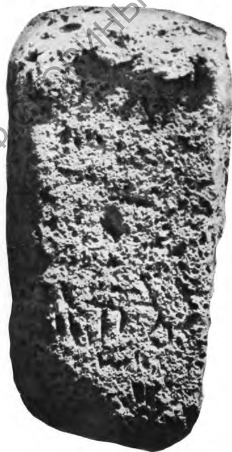
Рис. 7. Севанская стела «Б». Правая боковая сторона