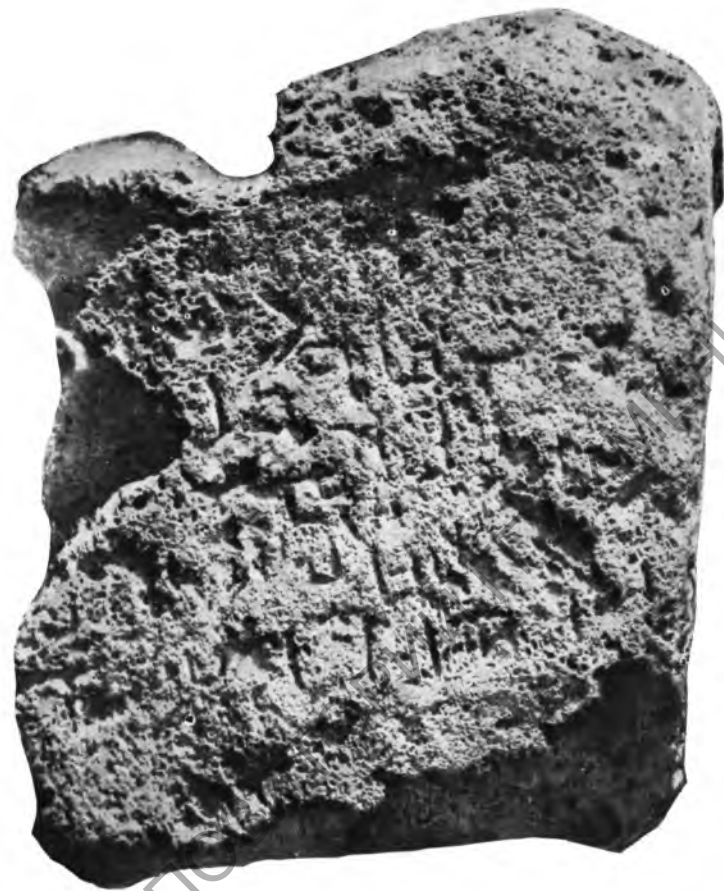
Рис. 6. Севанская стела «В». Лицевая сторона