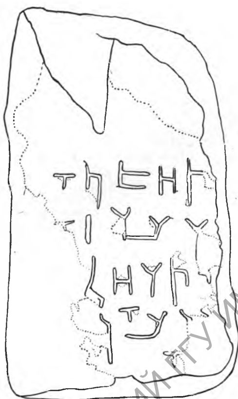
Рис. 4. Севанская надпись Б. Прорисовка

примыкающая к облому камня, которая может быть головкой N (головкой R или D она в данном случае не может быть, так как вследствие сохранности поверхности камня в этом месте было бы видно и второе ее ответвление); при этом откол камня, идущий здесь почти вертикально, мог, как это часто бывает, пойти по линии вреза