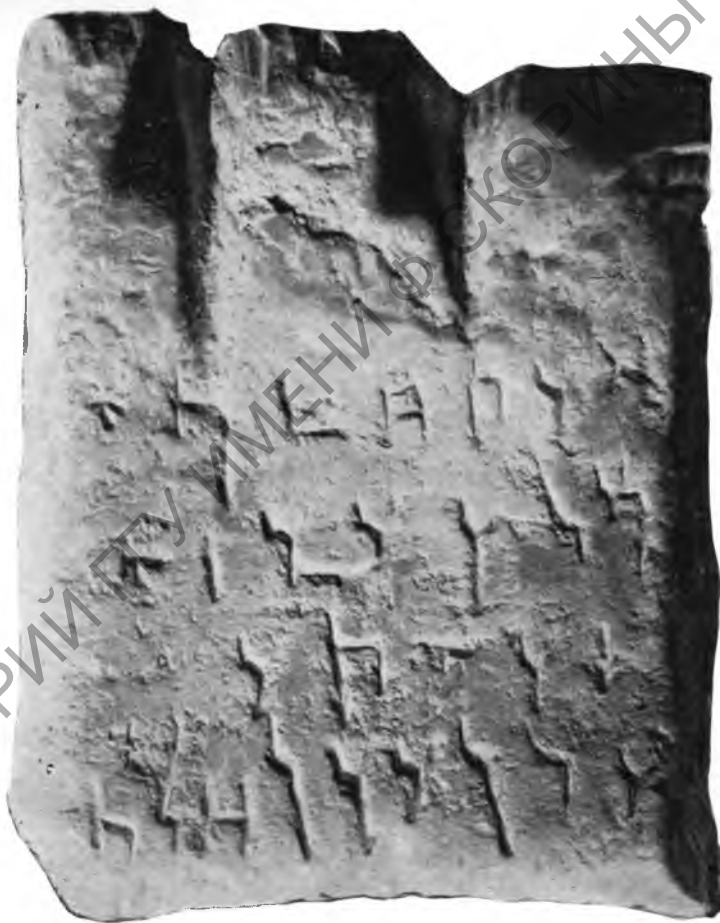
Рис. 1. Севанская надпись «А». Зеркальный снимок с эстампажа