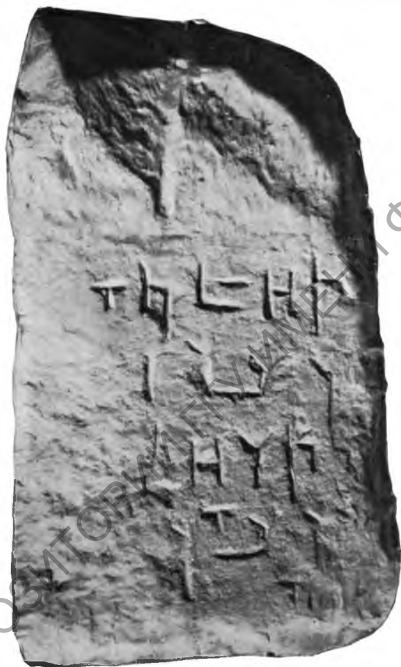
Рис. 2. Севанская надпись «Б». Зеркальный снимок с эстампажа