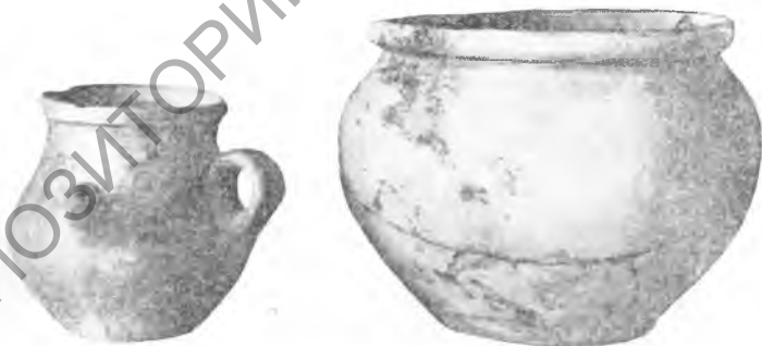
Рис. 7. Дагай-тепе. Сосуды. III—IV вв.

станке. Подобные грузила имели очень широкий ареал распространения в античную эпоху и даже в период бронзы 1 .