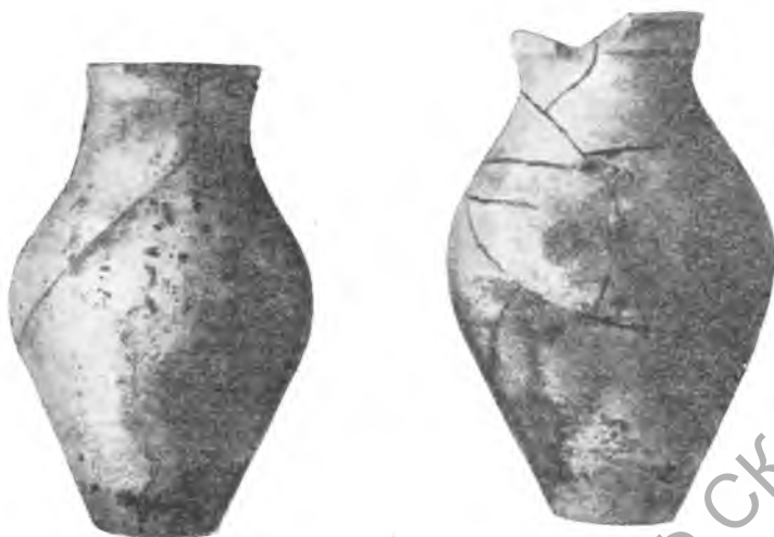
Рис. 1. Дагай-тепе. Тонкостенные кувшипочки. III—IV вв.

Археологические источники по истории населения Нахшеба в III—V вв. много богаче и разнообразнее. Даже небольшие разведочные раскопки в верхних слоях не-