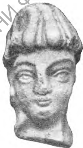
Рис. 16. Дагай-тепе. Терракота

Изучение материала археологических разведок и сопоставление его с письменными источниками дают возможность высказать предположение о некоторых событиях политической жизни в древнем Нахшебе.