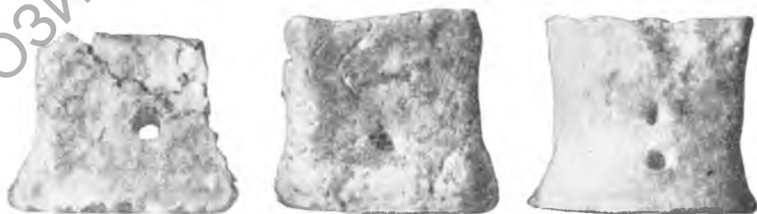
Рис. 9. Подставки для вертелов: а — из Шор-тепе; б — из Дагай-тепе; в — из Каркаваль-тепе

стержня вставлялись в отверстия или во вдавления, нанесенные на обе широкие стороны подставки.