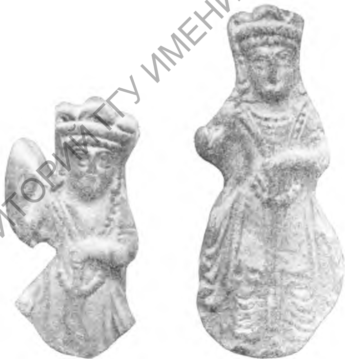
Рис. 13. Шор-тепе. Терракота. IV—V вв.

метром в 2,3 см; ширина пластинки — 0,9 см. На одной стороне пластинки вырезано изображение коня, на другой — крупного хищного животного, видимо, гепарда