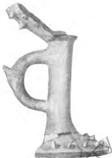
Рис. 8. Мудин-тепе. Фрагмент светильника (?). III—V вв.

Характерной чертой слоев III—V вв. является значительно большее количество лепной керамики, чем в предшествующее время. Подавляющую часть находок этого вида составляют фрагменты котлов грубой лепки, с большой примесью толченой керамики в глиняном тесте. На Шор-тепе в большом количестве встречались крупные фрагменты сосудов с закругленным дном 3 . В ряде памятников (Ер-курган, Мудин-тепе, Каджар-тепе и др.) найдены фрагменты чаш на высоких стержнях, украшенных налечным орнаментом в виде шипов и круглых комочков глины (рис. 8). Находки таких сосудов относительно редки; видимо, это — ритуальные светильники. Отметим еще глиняные подставки для вертелов, встречающиеся в большом количестве (рис. 9); видимо, две такие подставки служили опорой для стержня, на который нанизывались кусочки мяса при приготовлении его в виде шаплыка; концы