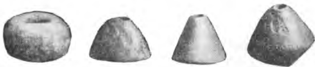
Рис. 5. Шор-тепе. Пряслица. IV—V вв.

Нередки находки пряслиц (рис. 5), преимущественно из глины, но встречаются и