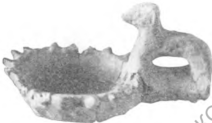
Рис. 10. Шор-тепе. Светильник. IV—V вв.

Как в культурных слоях, так и на поверхности поселений обнаружено некоторое количество памятников изобразительного искусства. Очень характерны грубо слепленные из глины изображения животных, главным образом баранов (рис. 10).