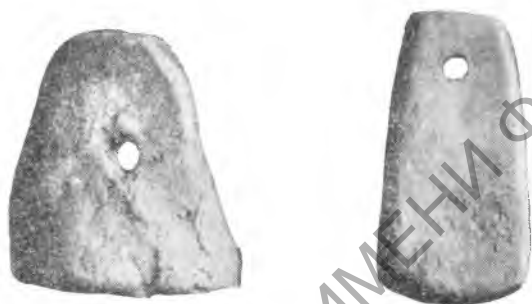
Рис. 6. Шор-тепе. Грузила ткацких станков ной глины (рис. 6, слева), другая — из необожженной (рис. 6, справа); высота последней — 5,5 см. находка таких грузил указывает, что ткали на вертикальном

Из орудий труда, характеризующих текстильное производство, интересна находка двух подвесок для ткацкого станка. Обе пирамидальной формы, одна из обожжен-