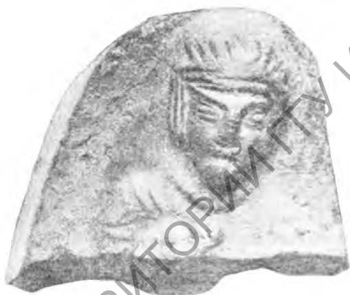
Рис. 15. Кендали-тепе. Терракота

На Дагай-тепе, при расчистке завала VIII—IX вв., было обнаружено терракотовое изображение головы женщины в высоком головном уборе, широкими валиками ниспадающем на лоб. Лицо европеоидного типа, асимметричное, с большими глазами, широким носом и пухлыми губами (рис. 16). Терракоту нельзя датировать временем, к которому относится завал, так как для этого периода (VIII—IX вв.) терракотовые изображения подобного типа не характерны. Статуэтка, видимо, относится к более древнему слою этого же памятника, т. е. к III—IV векам.