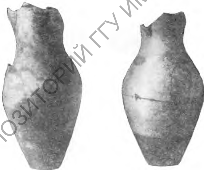
Рис. 2. Шор-тепе. Тонкостенные кувшипочки. IV—V вв.

которых памятников (Ер-Курган, Шор-тепе) дали возможность выявить интересный комплекс вещественных остатков, характеризующий материальную культуру общества.