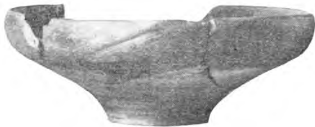
Рис. 3. Дагай-тепе. Чаша. III—IV вв.

Из сосудов станковой работы наиболее многочисленными и характерными для наслоений III—V вв. оказались тонкостенные кувшинчики, высотой в 13,5—16,5 см, найденные в хорошей сохранности или в крупных фрагментах на Мудин-тепе, Еркургане 1 , Дагай-тепе (рис. 1), Шор-тепе (рис. 2), в небольшом бугре близ селения