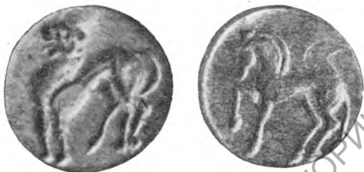
Рис. 12. Кафир-тепе. Костяные пластинки с изображением гепарда и коня. VI—VII вв.

Сходный по сюжету и стилю памятник обнаружен нами в более поздних наслоениях в развалинах другого поселения — на Кафир-тепе, находящемся в 2 км к югу от гор. Карши. Здесь в комплексе VI—VII вв. была найдена круглая пластинка из кости или рога, бледнокремового цвета, с плоскими боковыми поверхностями, диа-