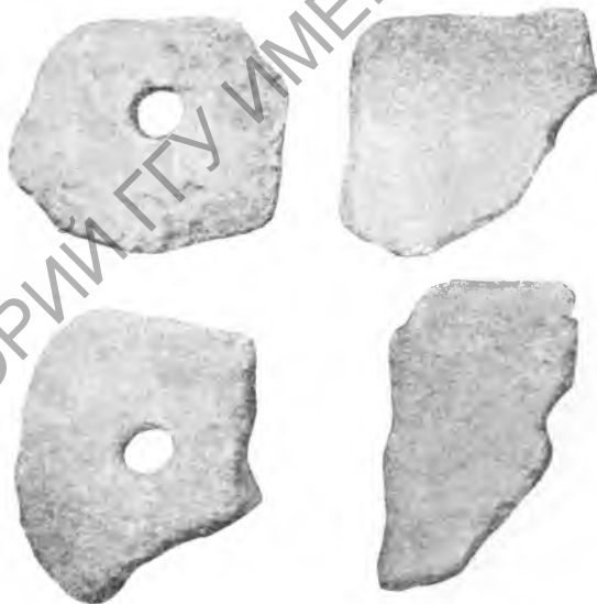
Рис. 4. Шор-тепе. Обломки ручных жерновов. IV—V вв.

Никуз и в ряде других памятников. находка таких сосудов в одном из памятников — на Шор-тепе вместе с монетами делает эти сосуды надежным датированным признаком. Вместе с кувшинчиками в ряде памятников встречались тонкостенные чаши на узком доннышке (рис. 3), покрытые красным ангобом — также весьма характерная керамическая форма для наслоений этих времен.