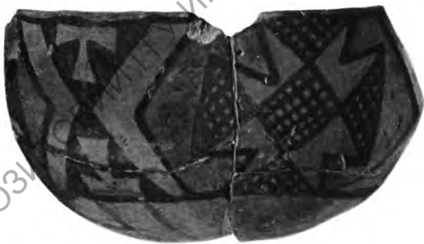
Рис. 3. Расписные сосуды Намазга III (вверху) и Намазга II (внизу)