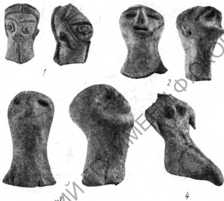
Рис. 5. Терракотовые статуэтки с Кара-депе (1, 2, 4) и Геоксюра (3)

земледельческих поселений, соответствующих по древности Джейтуну. Несколько фрагментов керамики, близкой к джейтунской, издано в сборках А. Стейна с Тали-Иблис в Кермане 1 , но до проведения раскопок трудно судить о наличии здесь поздненеолитических слоев. По-видимому, наиболее ранним земледельческим поселением на территории Ирана является поздненеолитическое поселение, остатки которого открыты в слоях Сиалка I. Среди расписной керамики Сиалка I, в целом синхронизирующей с Анау I, наибольший интерес представляет мотив в виде зигзагов 2 , идентичный росписи Анау IA и, как нам кажется, восходящий к росписи Джейтуна.