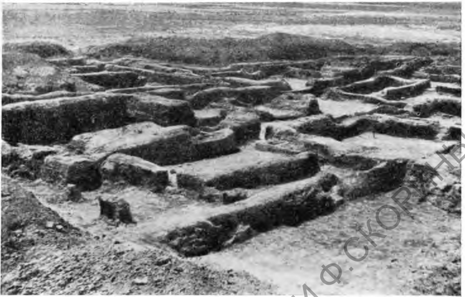
Рис. 2. Раскопки на поселении Геоксюр

В слоях Сиалк I имеются также костяные вкладышевые орудия, полностью идентичные серпу, найденному на Чопан-депе 1 . Однако по облику расписной керамики Джейтун и Чопан-депе представляются более ранними памятниками, чем слой Сиалк I, синхронизирующиеся по широко распространенной росписи треугольниками со слоями Анау I А и Б. Нижние слои Тепе-Сиалк относятся к позднему неолиту и в свое время были отнесены Р. Гиршманом ко второй половине V тысячелетия до н. э. 2 . Эта датировка пока не подвергалась серьезному пересмотру 3 , хотя не исключено, что она может быть изменена на более позднюю. На основании подобных сопоставлений поздненеолитическую культуру Джейтуна, как нам кажется, можно ориентировочно датировать второй половиной V тысячелетия до н. э.