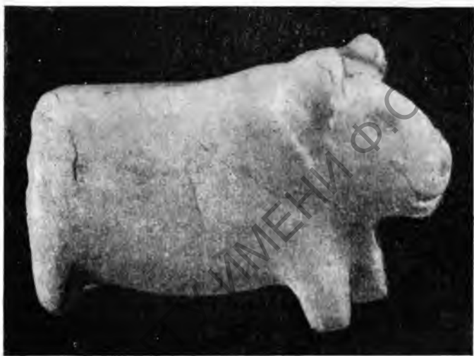
Рис. 4. Мраморная статуэтка быка из Кара-дере

теминара представляет собою культуры рыболовов и охотников-собираателей того времени, когда в более благоприятных природных условиях по долинам небольших речек и ручьев уже развивались поселения энеолитических земледельцев и скотоводов. Однако есть основания считать, что кремневый материал Джебела, особенно в его нижних слоях, может дать представление о кремневой индустрии раннеолитических племен, обитавших в прикопетдагской полосе. В таком случае значительное сходство, которое обнаруживается между кремневым инвентарем Джебела и Джейтуна, может свидетельствовать о каких-то местных корнях джейтунской культуры. Условия расположения и восстанавливаемый характер орошения древних полей Джейтунского поселения также свидетельствуют о самой начальной стадии развития земледелия, к которому перешли не-