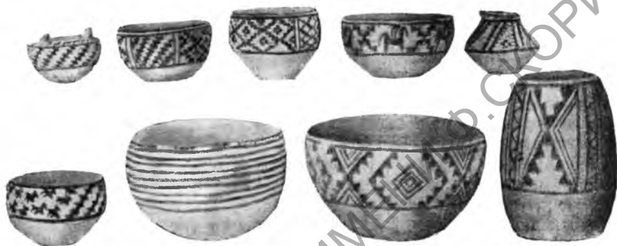
Рис. 7. Сосуды типа Намазга III с Кара-депе

Раскопки на Кара-депе показали, что крупное энеолитическое поселение площадью около 15 га сложилось здесь уже в пору Намазга I. В слоях этого времени, достигающих 7 м, обнаружена разнообразная рас-