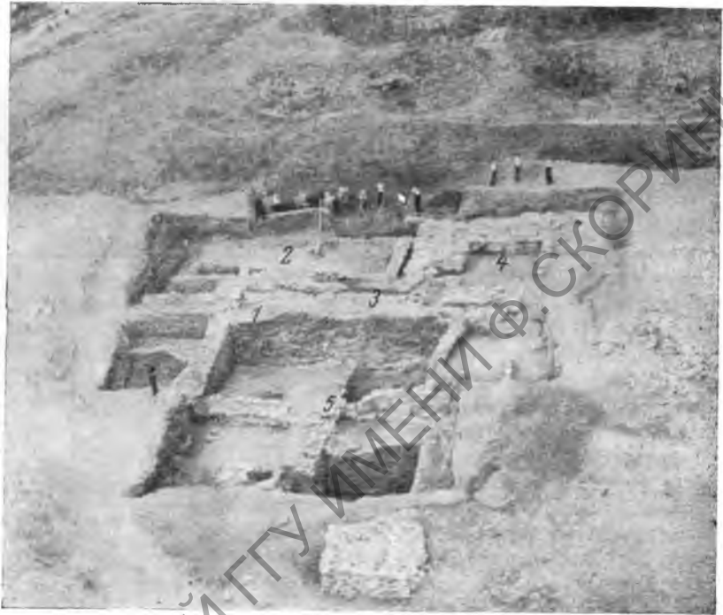
Рис. 6. Общий вид IV раскопа (аэрофотосъемка)

состоящей из щебня, суглинка и керамических обломков. Таким образом, каменная оборонительная стена, эта засыпь и восточная стена жилого комплекса составляли единое оборонительное сооружение, достигавшее около 5 м толщины. находка в засыпи многочисленных фрагментов керамики, датирующихся I в. н. э., и отсутствие в ней более поздних остатков заставляют нас относить время возникновения этого сооружения к началу II в. н. э.