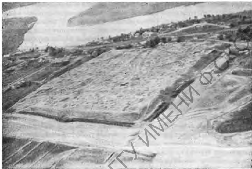
Рис. 7. Общий вид городища (аэрофотосъемка)

Таким образом, оказывается, что система оборонительных сооружений, ограничивших территорию города правильным четырехугольником рвов и стен, была создана во II в. н. э., ранее же город занимал несколько большую площадь, по крайней мере, в западном направлении. Самая планировка оборонительных сооружений Танаиса II в. н. э. с ее почти правильным квадратом стен (рис. 7) и с воротами в средней части южной стороны квадрата (ворота были открыты еще раскопками XIX в.) настолько разительно напоминает планировку римских лагерей, что невольно заставляет вспомнить