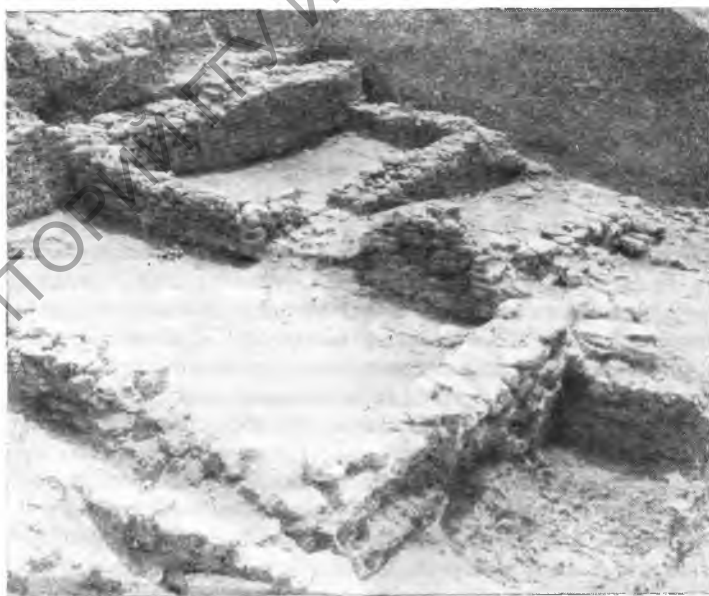
Рис. 4. Жилой комплекс I в. н. э. (раскоп IV)

о том, что жизнь в городе и после взятия его Полемоном продолжала нормально развиваться. О том же говорят и многочисленные находки керамики и других вещей, относящихся к I в. н. э., и наличие в танаисском некрополе богатых погребений, датирующихся тем же временем. С другой стороны, результаты раскопок заставляют нас критически