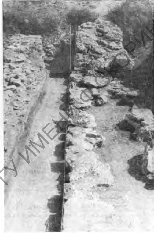
Рис. 5. Оборонительная стена II в. н. э. (раскоп II)

В первой половине II в. н. э. была построена оборонительная стена, обнаруженная раскопками в северо-восточной части городища (раскоп II). Открытый участок стены имеет протяженность 20 м, но в большей своей части стена разобрана почти полностью в новое время, прослеживаются лишь камни фундамента. Только на небольшом участке стена сохранилась на высоту более двух метров (рис. 5). С внутренней стороны к стене примыкал жилой комплекс, включавший в себя два мощных дворика и несколько помещений с глубокими подвалами. Возникновение этого комплекса также относится к началу второго века н. э., что явствует из стратиграфических наблюдений и подтверждается находкой между плитами дворика закатившихся туда двух монет Рискупорида II (68—92 гг.), имевших хождение в начале II в. н. э. Неширокое пространство между оборонительной стеной и параллельной ей восточной стеной жилой усадьбы не было оставлено пустым, но было заполнено специальной плотной засыпью,