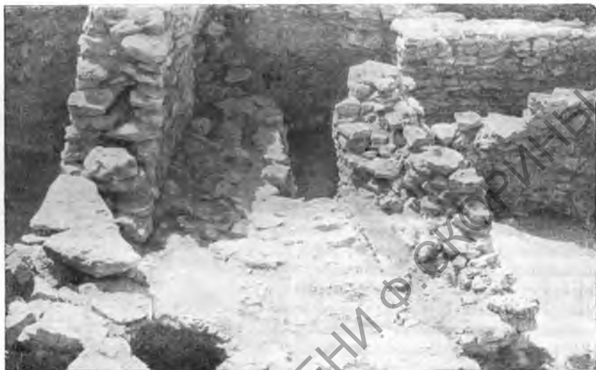
Рис. 3. Жилой комплекс III—II вв. до н. э. (раскоп VI)

Прежде всего совершенно несомненно, что полемоновское разрушение города не могло иметь того тотального характера, который приписывали ему прежние исследователи, предполагавшие даже последующее перенесение города на новое место. Уже самое возникновение упомянутого жилого комплекса в начале I в. н. э. свидетельствует