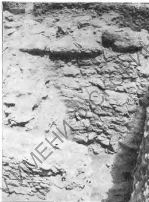
Рис. 2. Участок оборонительной стены III в. до н. э. (раскоп IV)

Постройка каменного жилого дома, прилегающего с наружной стороны к оборонительной стене, причем высота стен дома должна была быть несколько выше, чем сохранившаяся высота оборонительной стены, явно свидетельствует о том, что остатки стены II в. до н. э. в этот период никаких оборонительных функций несли не могли. Таким образом, вскрытые на этом участке архитектурные сооружения, несомненно, указывают на разрушение части оборонительных сооружений города около рубежа н. э. Это разрушение оборонительных стен представляется всего вероятнее связать с карательной акцией Полемона (Strabo, XI, 2, 3), которая должна падать как раз на это время. Вопрос о разрушении Танаиса Полемоном, неоднократно дебатировавшийся в науке, может быть пересмотрен теперь на основании учета точных археологических данных.