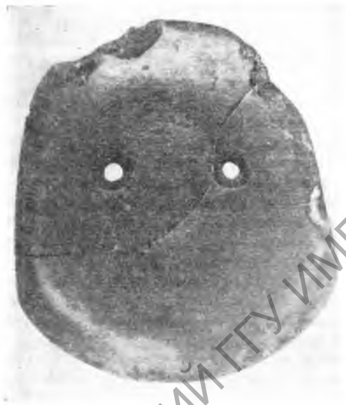
Рис. 1. Каменная мотыга с пос. Цицзымао

Как явствует из отчета Ли И-ю об исследованиях, проведенных на неолитическом поселении близ Цицзымао и в других местах, в западной части Внутренней Монголии также существовала культура, объединявшая яншаоские и микролитойдные элементы 5 . Поселение Цицзымао расположено в 27 км к северо-западу от уездного города Циншуй-хэ, на склоне холма. Участок, на котором число памятников неолитического времени особенно велико, имеет длину в 200 м и ширину в 100 м. На поверхности холма имеются