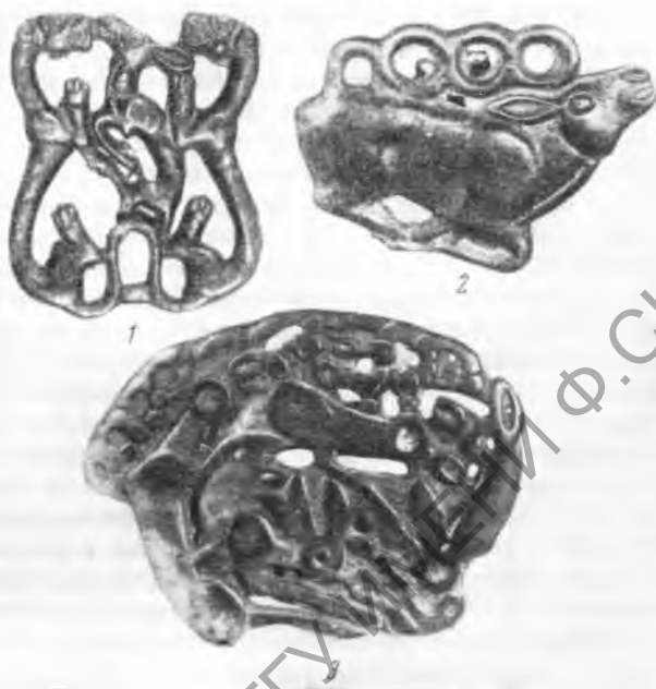
Рис. 3. Бронзовые бляхи, найденные на территории Ихчжаоского аймака (Ордос)

Лян Сы-юном. Ван Юй-пин обследовал 10 местонахождение неолитических каменных орудий и керамики в холмистой местности Гочэнцзышань, расположенной в 6 км к югу от города Линьси. Хотя здесь не обнаружено зольного слоя и погребений, однако находки прямоугольной формы каменной зернотерки, пестов каменных орудий в форме заступов позволяют предположить, что неолитические насельники этого района практиковали примитивное земледелие и вели оседлый образ жизни 11 . Собранные на Гочэнцзышане фрагменты сосудов темно-бурого и красновато-