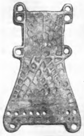
Рис. 4. Бронзовая пластинка, найденная в могильнике Эрланьхугоу

В четырех километрах к юго-западу от Эрланьхугоу, близ деревни Кэлимыншунь располагалось древнее сюннуское городище, которое, по мнению Ли И-ю, имеет непосредственную связь с могильником. Длина городища около 500 м, ширина его 200 м. Остатки вала, окружавшего некогда городище, достигают сейчас высоты 2 м.