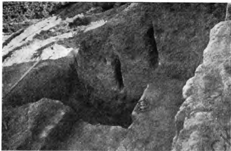
Рис. 1. Пирмат-баба-тепе. Башня. Вид с юга