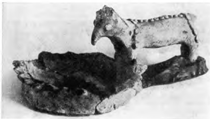
Рис. 4. Кош-тепе-2. Светильник с зооморфной ручкой