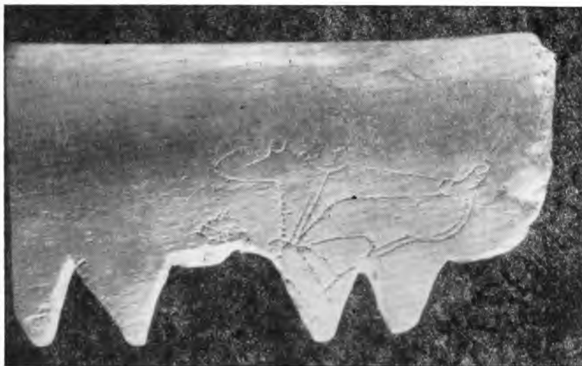
Рис. 5. Изображение лучника на кости из наслоений Айтугды-тепе

разом, археологические данные не подтверждают, вернее, не согласуются с вариантом чтения надписи на монете — „царь Кешский“. Видимо, письмо легенды еще будет предметом исследований лингвистов и нумизматов, однако и сейчас есть основание предполагать, что монету выпускали в пределах Нахшеба владетели, зависевшие от кушан или причислявшие себя к кушанам, как показывает один из вариантов чтения легенды, предложенный О. И. Смирновой.