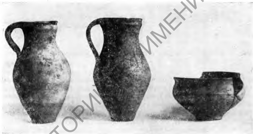
Рис. 2. Сосуды станковой работы из наслоений Пирмат-баба-тепе

ные в памятниках Каршинского оазиса III—VI вв. Найденные на Пирмат-баба-тепе кувшинчики относятся к древнейшему типу, датированному III—IV вв. 5 К этому же времени, думается, можно отнести первый и второй периоды в жизни здания. Верхнее здание, поскольку состав керамики не изменялся, а кирпич применен более поздний, датируется концом IV — началом V в.