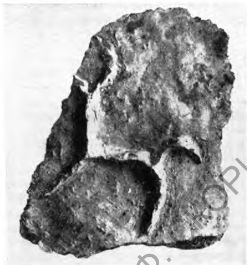
Рис. 7. Кош-тепе-2. Фрагмент котла с налепным схематическим изображением горного козла

По материалам более поздних раскопок на Кош-тепе-2 (1971 г.) устанавливается, что накладным орнаментом украшались и котлы, а также и крышки сосудов. Очень характерно схематическое изображение горного козла на котле (рис. 7), напоминающее по своим очертаниям наскальное изображение.