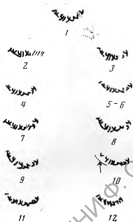
Рис. 6. Прориси надписей на нахшебских монетах: 1 — из наслоений Пирмат-баба-тепе, 2—7, 10 — из коллекций Государственного Эрмитажа (соотв. №№ 9669, 34744, 9670, 34745, 34746, 14092, 8486), 8—9 — из частной коллекции, 11 — из наслоений Айтугды-тепе, 12 — из коллекций Государственного Исторического музея, инв. 3142 *. В надписи восемь букв. Надпись одна. Древнейшее ее написание на монете 1 (Пирмат-баба-тепе), позднейшее — с элементами полукурсива — на монете 11 (Айтугды-тепе). Наиболее искаженная форма надписи и вместе с тем наиболее близкая к древнейшей — на монете 12. Прориси и интерпретация О. И. Смирновой

В памятниках каунчинского типа, насколько нам известно, не было обнаружено ни одного зооморфного изображения в сочетании со светильником; не было также ни одного изображения, закрепленного в горизонтальном положении, как на светильниках из Нахшеба. Причины различия в иконографии следует искать в самом содержании соответствующих представлений: в данном случае в рассматриваемых нами памятниках из Каршинского оазиса охранялась не вода, а огонь. Поэтому сосуды типа шортепинских светильников не следовало бы ставить в один ряд с каунчинскими кувшинами 23 . Тем не менее типологическое различие не исключает семантической идентичности всех этих изделий, что позволяет считать кангюйцев, как вытекает из изложения Б. А. Литвинского, их обладателями.