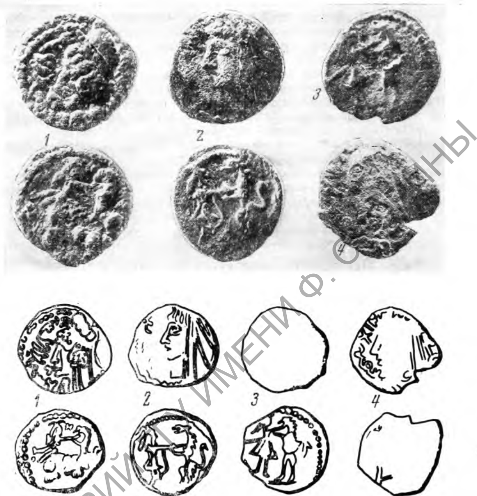
Таблица I. Нахшебские монеты: 1 — из наслоений Пирмат-баба-тепе, 2 — из окрестностей г. Карши, 3—4 — из наслоений Айтугды-тепе. (Увеличено)

над полом коридора, и была найдена упомянутая выше монета. В третий период древнее здание, включая и башню, было взято как бы в футляр и над ним, на высоте уже 6 м от поверхности окрестных полей, на образовавшейся площадке было выстроено новое здание, в остатках стен которого обнаружен сырцовый кирпич размером 44 \times 22 \times 8 см. Таким образом, устанавливается, что монета была найдена на глубине примерно 2 м от пола этого верхнего здания. Таковы основные стратиграфические данные, касающиеся обстоятельств находки монеты 3 .