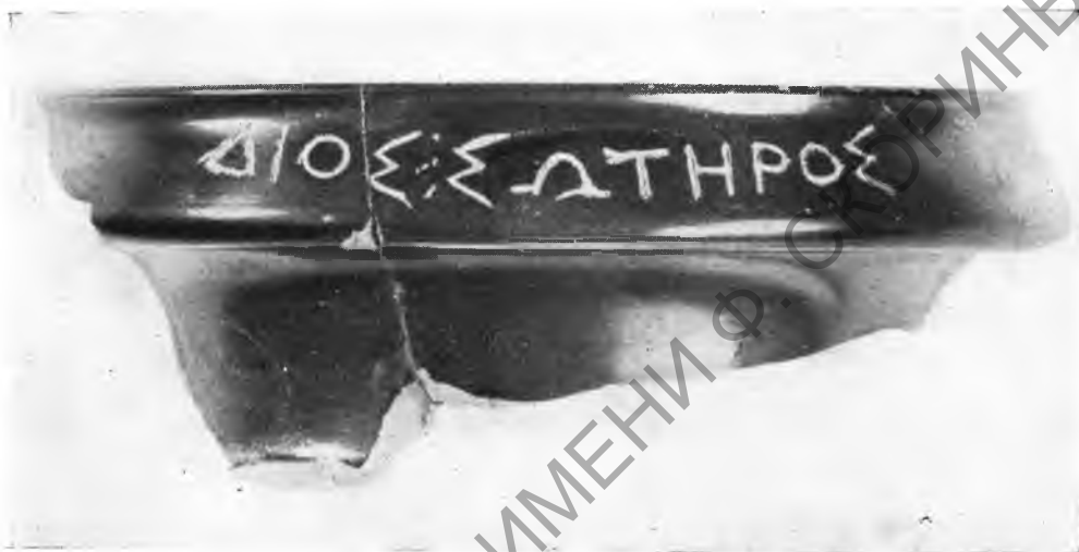
Рис. 1. Фрагмент килика из раскопок зольника-эсхары в Мирмекии