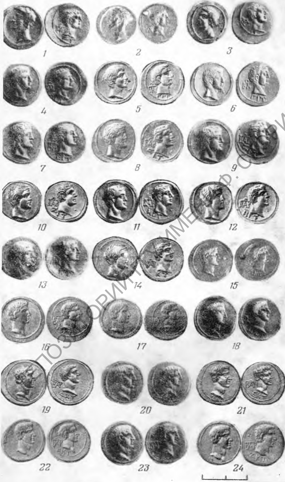
Таблица II. 1-3 — боспорские статеры; 4-24 — статеры Аспурга