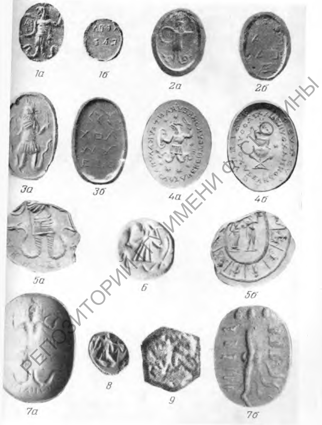
Таблицы I—V. Гностические геммы, перстни и амулеты юга СССР