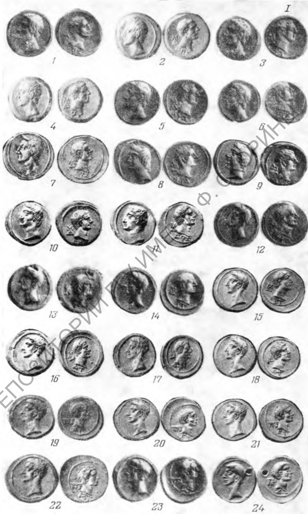
Таблица I. Боспорские статеры