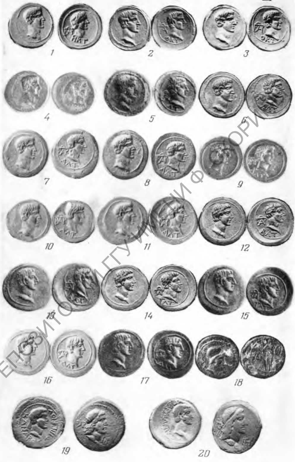
Таблица III. 1—17 — статыры Аспурга; 18—20 — медныя монеты Аспурга