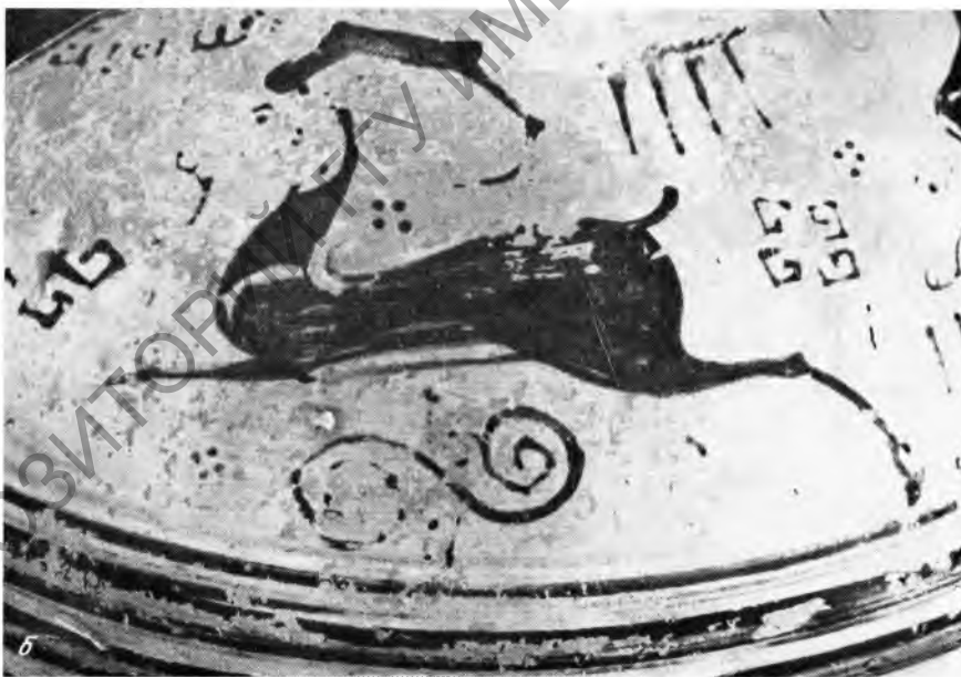
Рис. 2. Ойшохоя из Филатовки. Детали