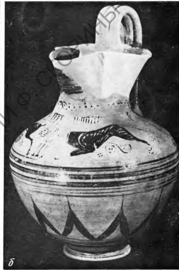
Рис. 1. Расписная родосско-ионийская ойнохоя из Филатовки