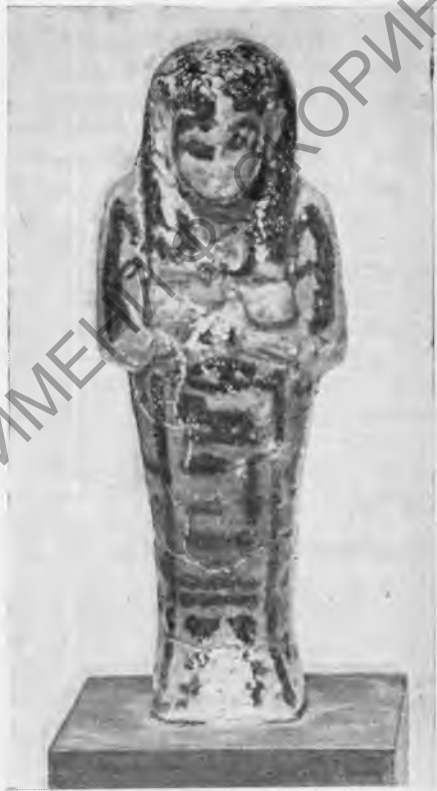
Рис. 4. Жена царя Хенуттауи

К этому же периоду относится ушебти жреца Амона Неспанеферхора (ns-pꜣ-nfr-ḥr), инв. № 1634. Это статуэтка из ярко-голубого фаянса высотой 10,9 см, в форме мумии. Руки скрещены на груди, держат орудия труда. Парик длинный, с черными полосками (сзади не сделан), вокруг