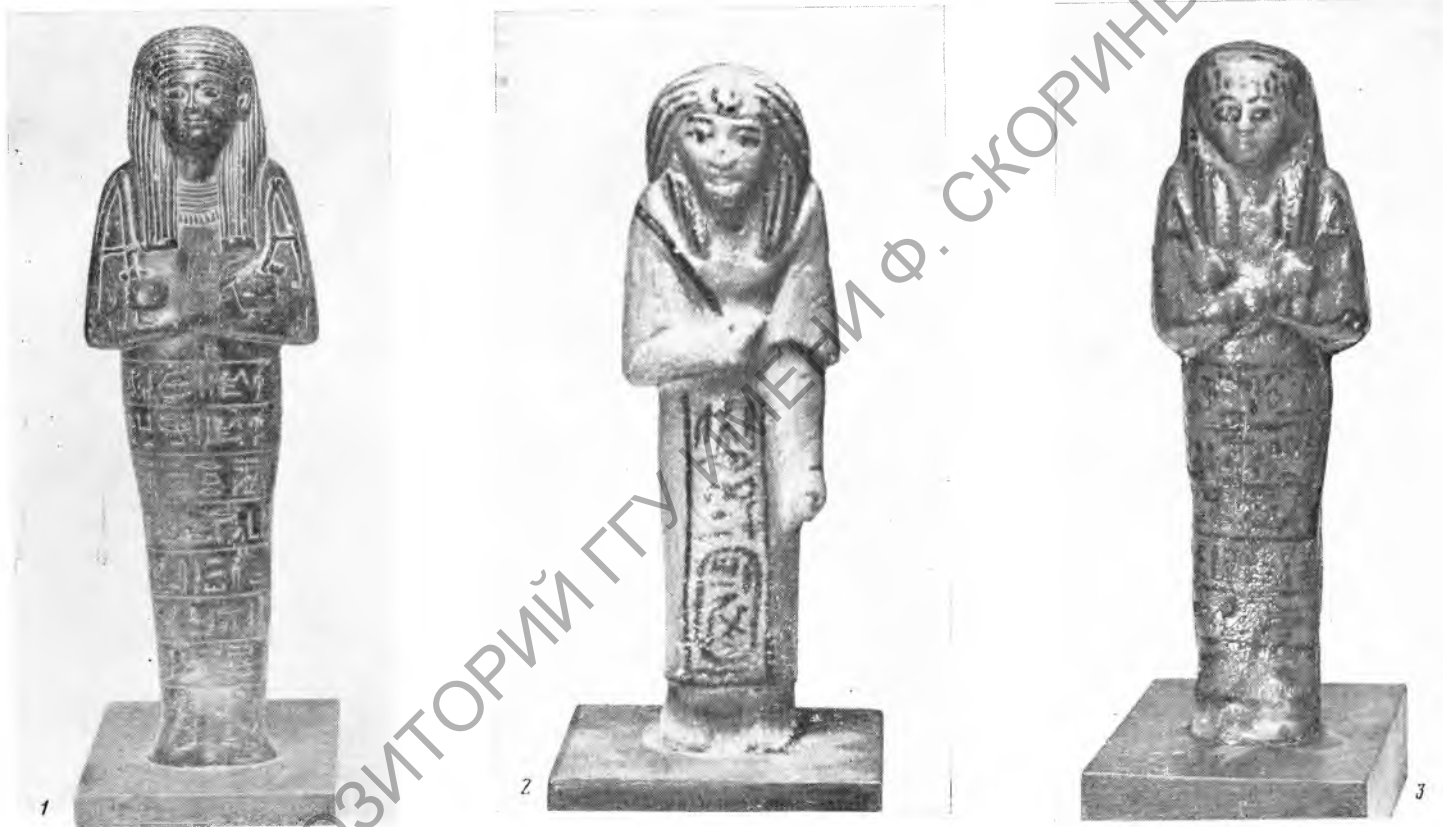
Рис. 3. 1 — главный воєначальник Каса; 2 — царь Найноджем I; 3 — Найноджем II, верховный жрец Амона.