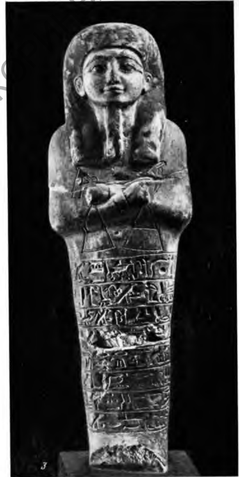
Рис. 1. 1 — десятник; 2 — начальник садовников Хат; 3 — писец счета скота Амона Самут