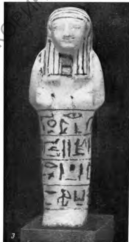
Рис. 2. 1 — правитель Куша Усерсатет; 2 — начальник ювелиров Пнни; 3 — везир Хайя