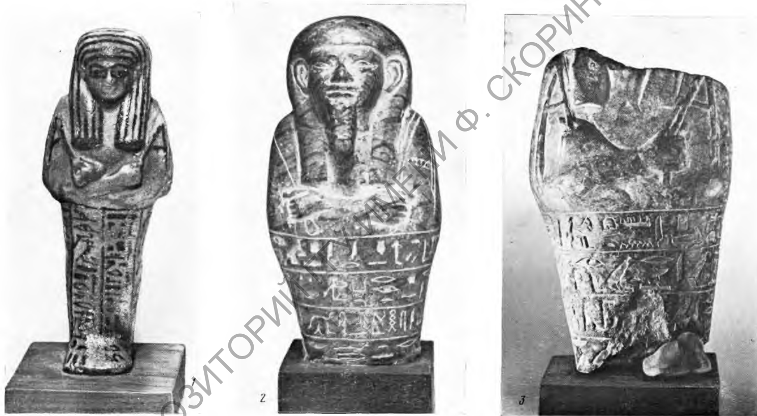
Рис. 5. 1 — Нестанебишеру; 2 — правитель дома Харуи; 3 — херихеб Падшамоншет