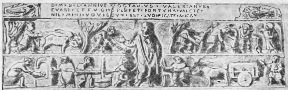
Рис. 2. Саркофаг Луция Анния Октавия Валериана I в. н. э.

и его продаже. По мнению И. М. Ростовцева, поддержанному и другими учеными, фрески на стенах помпейских домов — прямое указание на род занятий их владельцев, и, следовательно, Веттии производили вино, выращивая виноград в своих поместьях 77 . Действительно, в самом доме были найдены многочисленные сосуды с вином, на которых были надписи, указывавшие, из каких поместий они доставлены. Но в доме Веттиев есть фреска, изображающая праздник пекарей — Весталии. Можно заключить, что владельцы дома имели отношение к устройству пекарен и снабжению их зерном. Это и не удивительно. Исследования М. Е. Сергеевко и В. И. Кузицина показали, что рабовладельческие поместья I—II вв. н. э. были многоотраслевыми хозяйствами с преимущественным развитием одной из отраслей. В таком поместье находилось место и для зернового поля 78 . Изучение помпейских вилл показало, что хлебное поле было на виллах № 5, 14, 25, 27 и 34 (откуда зерно могло поступать в город). В некоторых из них были обнаружены печи, причем печь на вилле № 34 ничем не отличалась от печей городских пекарен, интенсивно работавших на рынок 79 , хотя зерновые не были основной культурой на этих виллах.