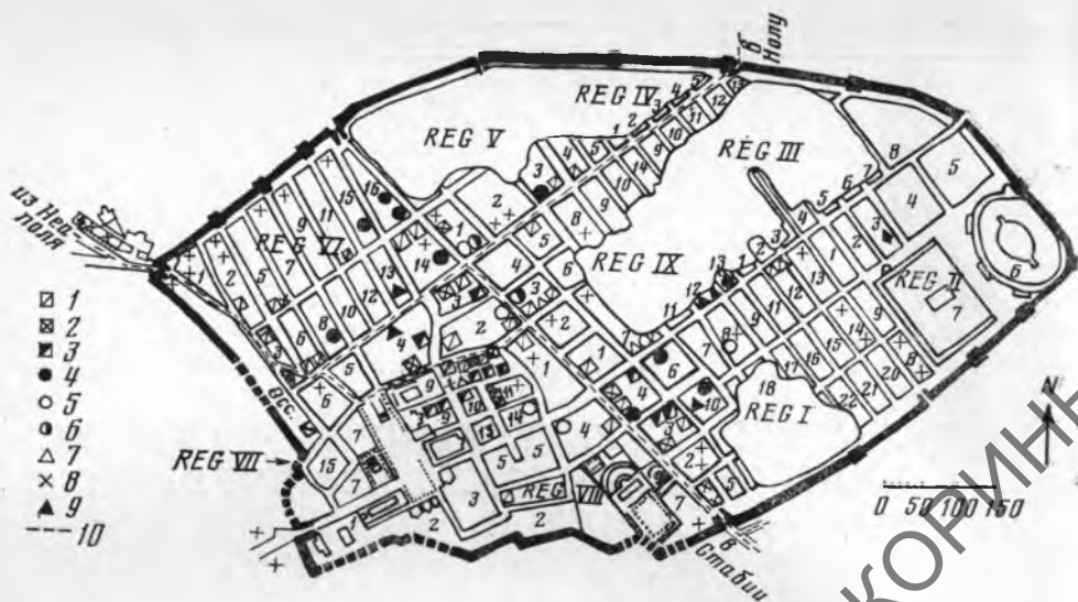
Рис. 1. Схема расположения мастерских в Помпеях. 1 — пекарни; 2 — пекарни-дудльциарии; 3 — лавифрикаррии; 4 — фуллоники; 5 — инфектории; 6 — оффектории; 7 — коактилярии; 8 — гостиницы и мастерские; 9 — ткацкие мастерские; 10 — пути следования

связь товарных ремесел ремесленного центра с сельскохозяйственной округой и структура его рыночных связей. Такой подход к решению проблемы диктуется известным положением Н. Маркса, согласно которому античная форма собственности, неразрывно связанная с античной общиной, «предполагает в качестве своего базиса не земельную площадь как таковую, а город как уже созданное место поселения (центр) земледельцев (земельных собственников). Пашня является здесь территорией города...» 4 . Город, представляя собой средоточие ремесла и торговли, в то же время был и организацией землевладельцев. Да и большинство ремесленных отраслей базировалось на сельскохозяйственном сырье. Все это накладывало определенный отпечаток на развитие античного городского ремесла, что необходимо постоянно учитывать при анализе функционирования ремесленного центра.