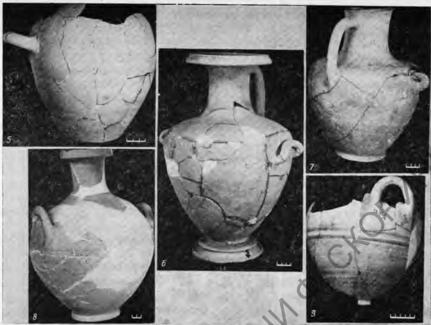
Рис. 2. 5—9 — вазы Гадра

ли, подобно боспорским наемникам, служить у первых Птолемеев 96 , и допуская возможность попадания с профессиональными воинами такого рода изделий в Ольвию и Херсонес, нельзя не принимать в расчет и другие «пути», связанные, например, с теми же наемниками — выходцами из других мест 97 , купцами, мореплавателями, послами, феорами, вызванные проникновением египетских эллинистических культов, различными контактами с соседними областями и т. д.