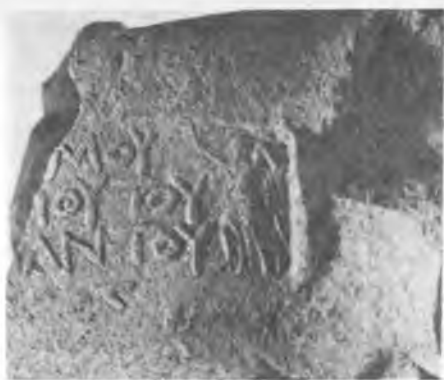
Рис. 1. Эмблема «Ника» в клейме сивоского астинома Дионисия Апемантова