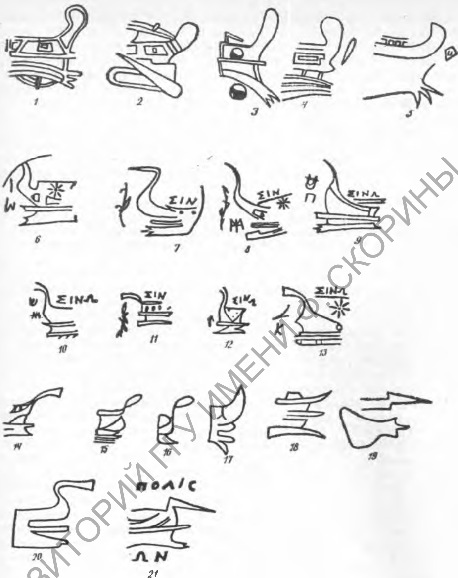
Рис. 3. Эмблема «прора»: 1—5 — римские монеты; 6—13 — синопское серебро III в. до н. э.; 14—20 — эмблемы синопских клейм; 21 — эмблема фасосского клейма (первая треть III в. до н. э.)

а также на анонимной понтийской меди 47 . Наиболее ранний дифферент «звезда» отмечен на монетах, чеканенных на рубеже VII—VI вв. до н. э. в Потидее 48 . Широкое распространение этого изображения приходится