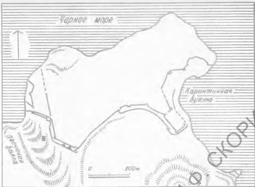
Рис. 1. План Западного некрополя Хадрианополя

штамповки: на его лицевой стороне изображена в профиль влево задранированная фигура Фортуны с вытянутой вперед левой рукой; слева у ног наклонно стоит рулевое весло, один из временных атрибутов богини. В правой руке богиня держит рог изобилия, под которым читается изображение, не совсем привычное для сюжетов, связанных с Тяхэ-Фортуной, в котором, однако же, не без труда узнается бородатый змей Гликон. По краю лицевая сторона медальона украшена ложновитым кантом, припаянным к золотой пластине. В верхней части имеется профилированная петля для подвешивания, припаянная к оборотной стороне медальона (рис. 4). Высота медальона с ушком для подвешивания — 22, ширина — 12, толщина — 2 мм 3 .