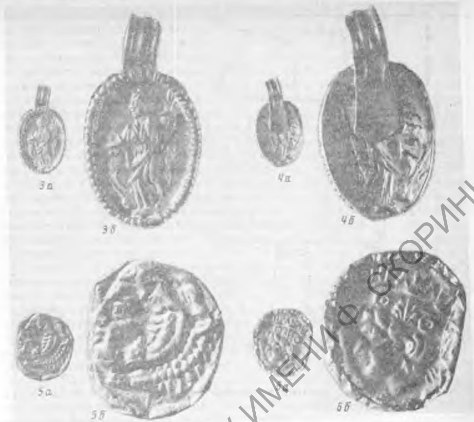
Рис. 3. а—б. Лицевая сторона золотого медальона из склепа 1982 г.