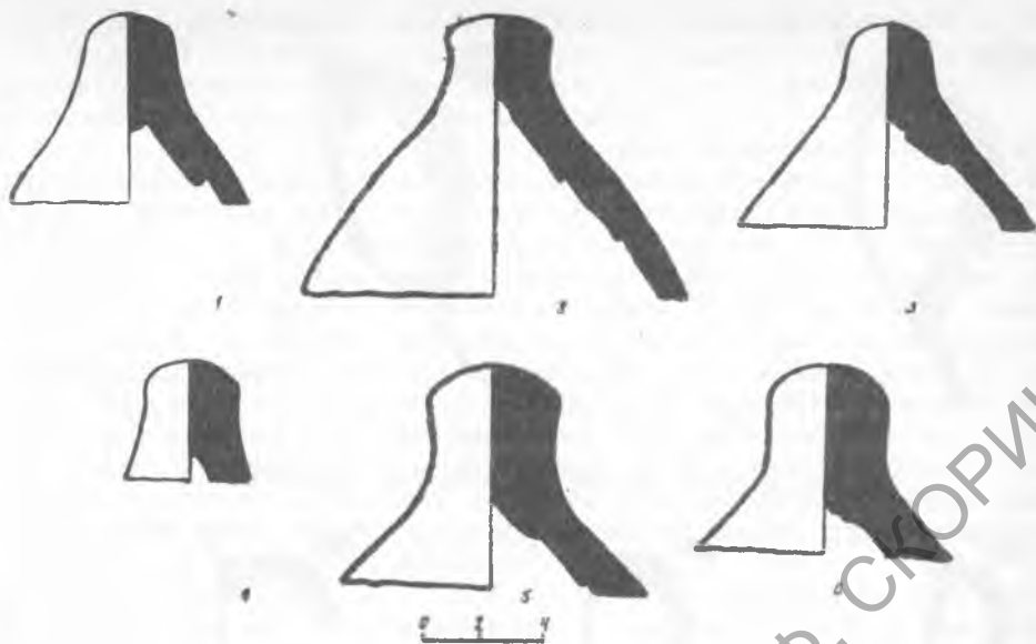
Рис. 1. Ножки колхидских амфор из Херсонеса

На территории Херсонеса и его хоры 18 встречаются фрагменты колхидских амфор эллинистической эпохи. Самые ранние экземпляры датируются концом IV—III в. до н. э. Это одна массивная амфорная ножка из Херсонеса 19 и три — из поселения Маслины в Северо-Западном Крыму 20 (рис. 1, 1, 2, 3).