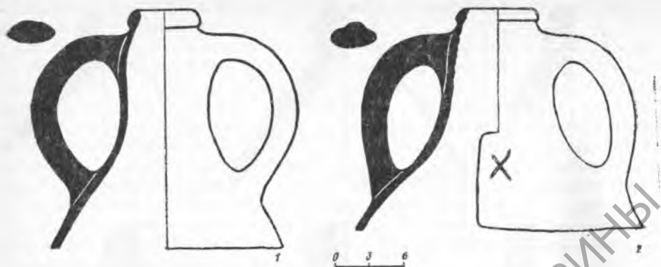
Рис. 2. Горла колхидских амфор из Херсонеса