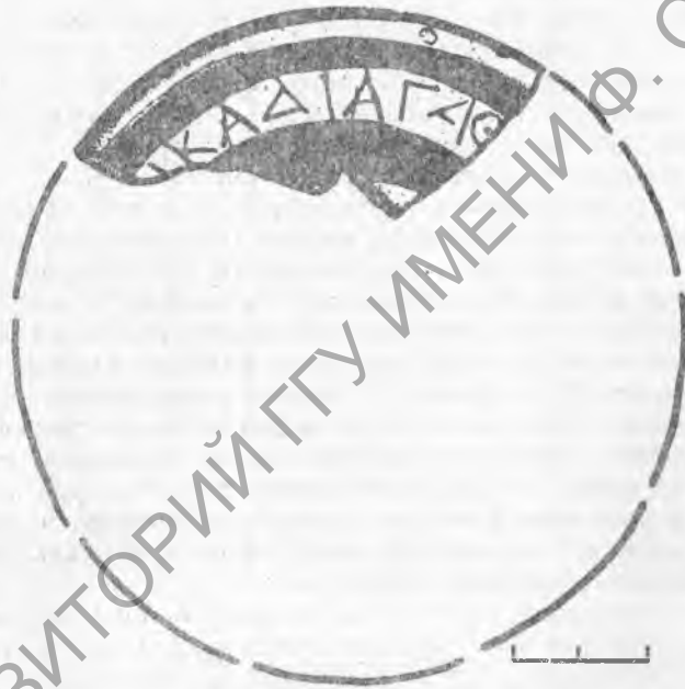
Рис. 2. Прорись

нашем граффито крайне сомнительно. Поэтому едва ли вызовет возражение дополнение этой группы букв в [ε]ἰκάδι — «двадцатого числа».