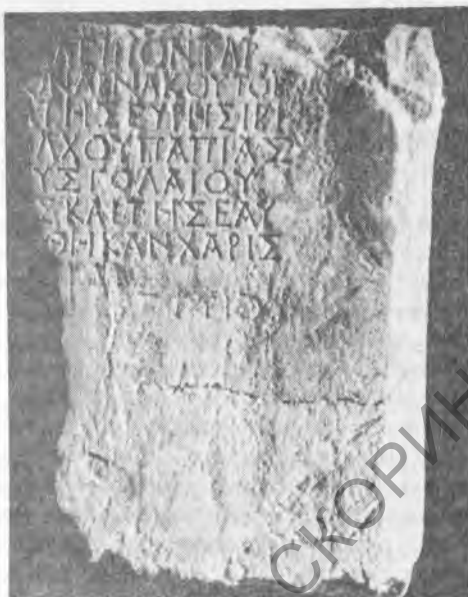
Рис. 3. 1—2 — рельеф и посвятельная надпись из с. Осетровка

(рис. 3, 1). Высота плиты 50 см, ширина сверху 40, снизу около 32 см, толщина 15 см.