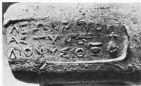
Рис. 3. Клеймо Леокрита

Начиная с середины IV группы регулярно встречаются отчества магистратов. По сравнению с данными книги Б.Н. Гракова материалы IOSPE III позволяют определить ранее не известные отчества астиномов (см., например, табл. III, 12, 96, 106). В публикации коллекции из Истрии в легенде клейма магистрата IV группы Кратистарха восстановлено его