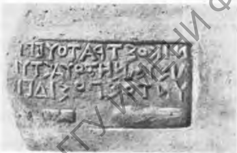
Рис. 1. Клеймо Посидея

Некоторые из произведенных исправлений требуют дополнительных комментариев. Е.М. Придик, опубликовавший эсиметное клеймо (табл. II, 4, рис. 1) 23 , вначале неверно истолковал слово αἰσυνήτης как магистратское