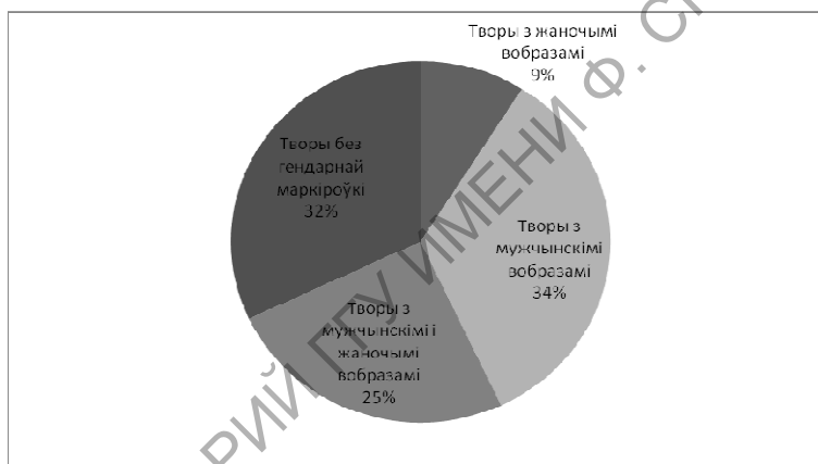
Малюнак 2 – Гендарная маркіроўка прозаічных твораў