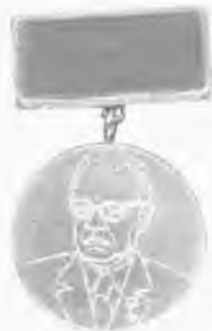
Медаль, вручаемая лауреату Премии имени Ф. И. Федорова Национальной Академии наук