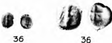
Табл. III. Таманский клад серебряных монет VI–IV вв. до н.э.