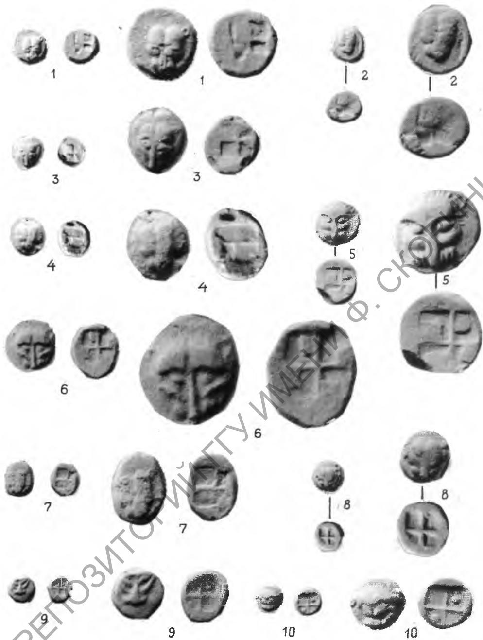
Табл. I. Таманский клад серебряных монет VI–IV вв. до н.э.