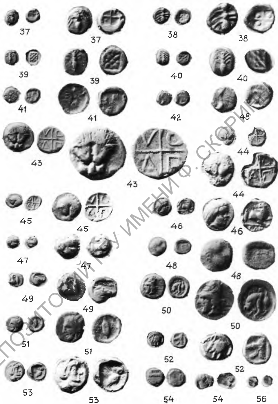
Табл. IV. Таманский клад серебряных монет VI–IV вв. до н.э.