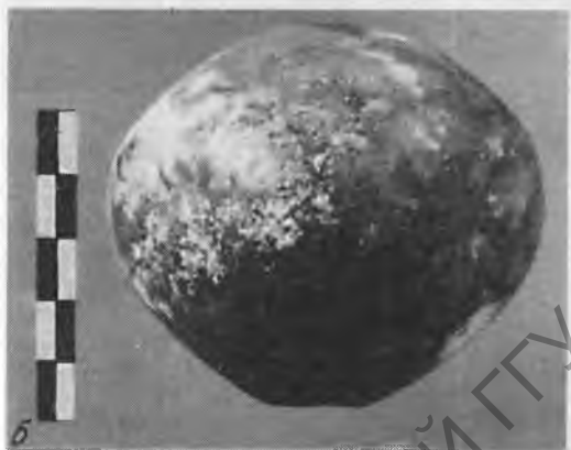
Рис. 6 а-в. Навершие булавы. Известняк. Раннее / Древнее царство

лась одна из резиденций фараона и была отстроена так называемая «крепость» 22 , был в то же время и городом, где окончательно формировались и откуда отправлялись торговые и военные экспедиции. Администрация города хранила в течение некоторого времени до момента распределения захваченные или приобретенные в походах ценности. Отсюда начинался, по всей видимости, «Путь оазиса» (w't wh't) 23 , который вел к оазисам Западной пустыни и к Ливии. В оазисе Бахария был найден блок с надписью («... сказано Ха, владыкой Запада, богом великим Абидоса» 24 ), свидетельствующий о распространении египетского влияния на оазисы. Позже, во времена Нового царства, оазисы Дахла и Харга были присоединены к 8-му египетскому ному (Urk. IV. 963. 14) 25 .