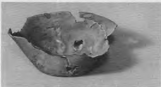
Рис. 9. Чаша из серебра (?). Раннее / Древнее царство