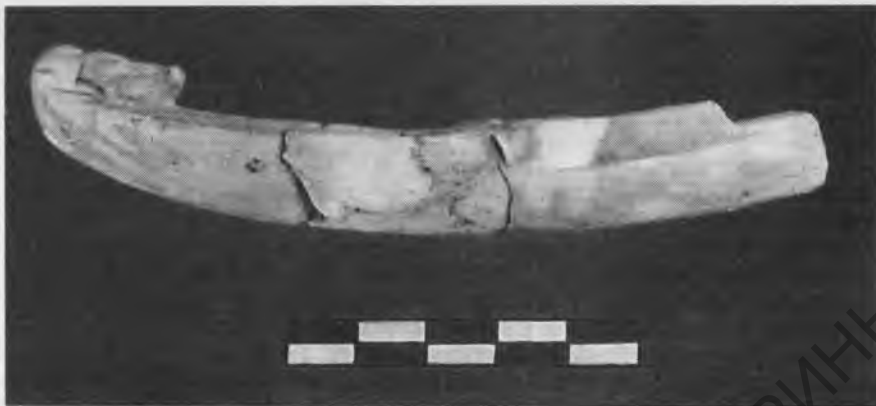
Рис. 3. Лодочка в форме ежа. Обожженная глина. Раннее / Древнее царство

додинастических артефактов 11 , а также остатки строений времени Древнего царства косвенно указывали на возможность существования под фундаментом времени раннего Среднего царства более древнего святилища.