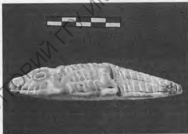
Рис. 8. Фигурка крокодила. Фаянс. Раннее / Древнее царство

Нехена (Иераконполь) до «внешнего юга южных стран» 27 , а наместнику Хеви «от Иераконполя до Напаты» 28 .