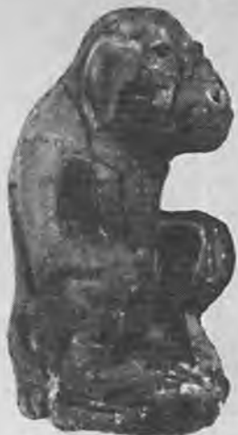
Рис. 5. Фигурка павиана. Слоновая кость. Раннее / Древнее царство

Дельта была заселена египтянами начиная с додинастического времени и вплоть до позднего Нового царства 17 . При этом ранние археологические культуры восточной части Дельты аналогичны культурам западной, а именно тем, что были обнаружены в Буто. Можно с уверенностью сказать, что влияние «азиатских» племен, каковое должно было бы быть наиболее сильным в этой части Дельты, не было тем не менее значительным: находка в Телль Ибрахим Аваде лишь нескольких глиняных сосудов неегипетского производства на фоне многочисленной египетской керамики, отсутствие видимых следов «азиатского» стиля в архитектуре – все это доводы в пользу заселения Дельты с додинастического времени египетскими племенами, которые безусловно контактировали с восточными соседями, но не в такой степени, как было принято считать. Более того, изучение Телль Ибрахим Авада позволило определить приблизительные пути миграций египтян в додинастическое время. Так, одна из миграционных волн пришла из Нильской долины, разделившись на две части несколько южнее этого поселения 18 .