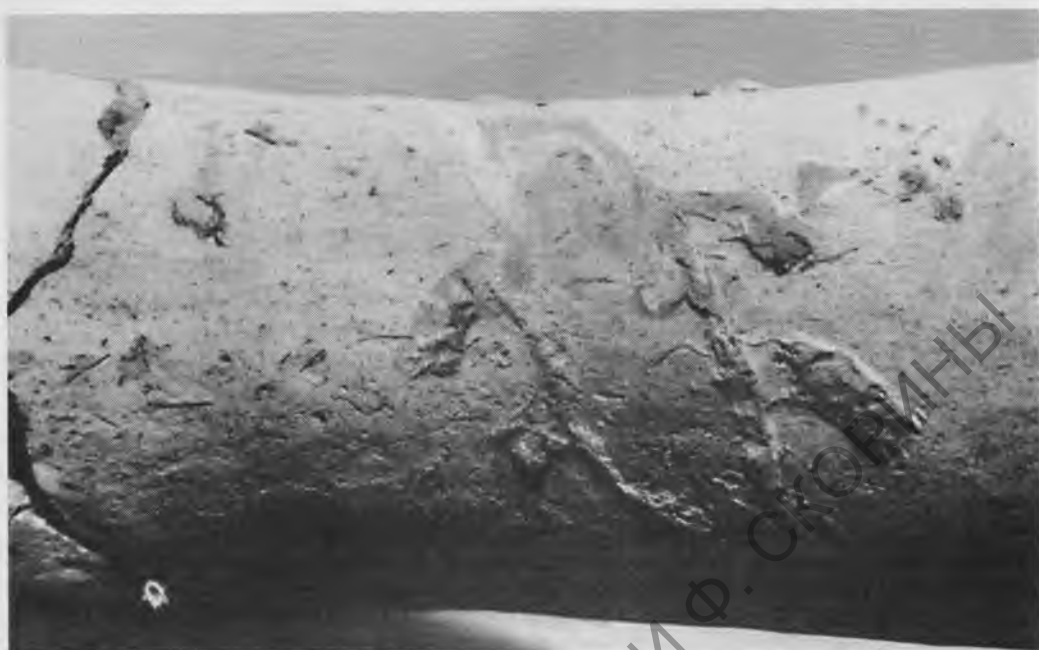
Рис. 7. Фрагмент подставы с двумя налестями в виде крокодилов (?). Обожженная глина. Раннее / Древнее царство