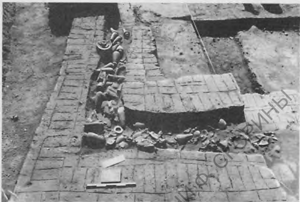
Рис. 11. Хранилище сосудов, используемых для «ритуала очищения». I Переходный период

на булаву царя было великой честью. Именно булаву пускает в ход фараон, чтобы покончить с врагами. Посвятельство на булаву было равносильно посвятельству на военную власть. От булавы, согласно сказке, погиб проявивший к ней повышенный интерес азиат, гость фараона и посланец чужеземной страны.