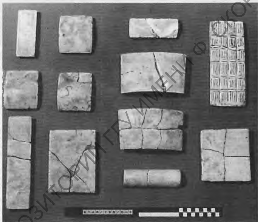
Рис. 10. Облицовочная керамическая плитка. Фаянс. Раннее / Древнее царство

Предметы, найденные в перечисленных городских храмах, на первый взгляд, казалось бы, случайные, вряд ли можно считать таковыми в действительности. Фаянсовые облицовочные плитки всевозможной формы первоначально украшали, без сомнения, фасад царского дворца. Похожие можно увидеть на фасаде дворца фараона III династии Джосера, часть которого реконструирована и выставлена в Каирском музее. Как известно, одно из наиболее ранних царских имен, хорово , выписывалось на серехе – изображении фасада дворца и символизировало царскую власть. Найденные в большом количестве булавы безусловно олицетворяли военную мощь фараона, что было особенно важно для пограничных городов. В этом смысле показательно написание иероглифа A 23 (GG. Sign List), изображавшего царя, в одной руке которого была булава – символ военной мощи. Из литературного памятника Нового царства – сказки «Взятие Юпы» следует, что даже взглянуть