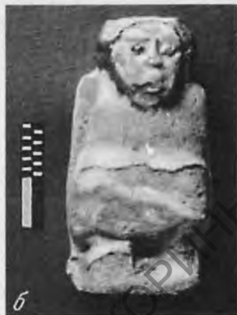
Рис. 4 а, б. Фигурки азиатов. Фаянс. Раннее / Древнее царство

ставок украшена двумя наклепками в виде крокодилов (гекконов?), расположенных «валетом» 14 (рис. 7). Скорее всего, Ментухетеп Сеанехкара не был основателем храма в строгом смысле слова, а лишь перестроил или, возможно, восстановил его.