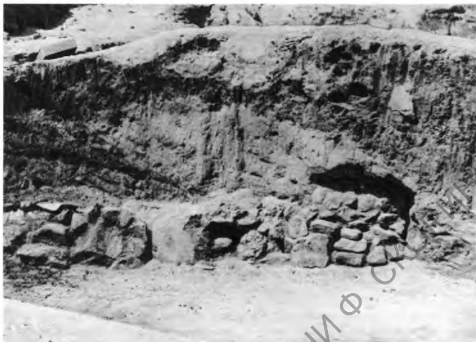
Рис. 3. Южная стена некрополя. Вид с юго-востока

имеют совершенно иную форму, отличаясь более сложным декором 4 . Высота букв надписи на надгробии колеблется от 2,5–2,7 см до 3 см (рис. 1, 2). Имя, отчество и этникон умершего читаются отчетливо: