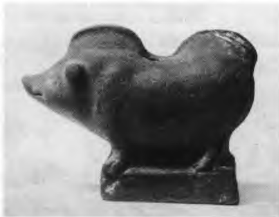
Рис. 4. Терракотовая фигурка вепря из погребения 66

погребальный инвентарь данного захоронения состоял только из одного костяного предмета кольцеобразной формы неясного назначения, находившегося у левой тазобедренной кости. По стратиграфическим наблюдениям это погребение можно датировать первой четвертью IV в. до н.э.