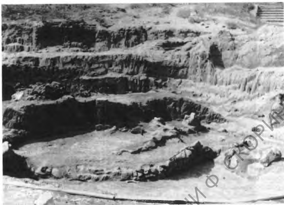
Рис. 5. Северо-восточная стена некрополя Аполлонии. Вид с северо-востока