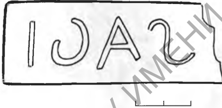
Рис. 3. Кирпич с клеймом

в Каппадокии в середине II в. н.э. Исходя из этого исследователь считает, что остальные четыре когорты, упоминаемые Аррианом, также были вспомогательными 6 .