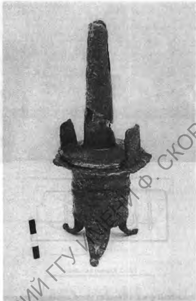
Рис. 4. Бронзовый канделябр

В кастелле Апсара, в пределах вышеупомянутой постройки был обнаружен бронзовый канделябр на трех ножках с цилиндрическим корпусом, конической трубкой для фитиля и двумя фризами вокруг корпуса (рис. 4) 9 . На нижнем фризе имеется надпись: C. SON AVR C.R. (рис. 5). Ее можно расшифровать так: первая буква С должна соответствовать инициалу ее владельца, следующие после SON три буквы – AVR (elia), очевидно, сокращенное имя римского императора Марка Аврелия (161–180 гг. н.э.). Последние две буквы можно истолковать как C(ivium) R(omanorum). Полностью надпись должна выглядеть так: C. SON(ors) AVR(elia) c(ivium) R(omanorum). Следует отметить, что вспомогательные когорты, носившие имя Марка Аврелия, стояли и в придунайских провинциях 10 . Общепринято мнение, что клейма с аббревиатурой.