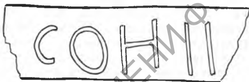
Рис. 1. Кирпич с клеймом