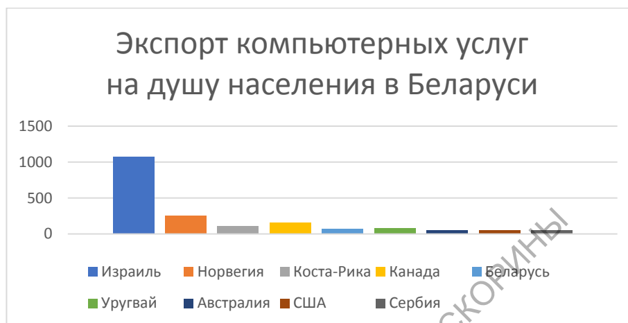
Рисунок 1 - Мировой рейтинг по экспорту компьютерных услуг на душу населения

Мировой рейтинг по экспорту компьютерных услуг на душу населения может быть представлен в следующем виде (Рисунок 1)[1]