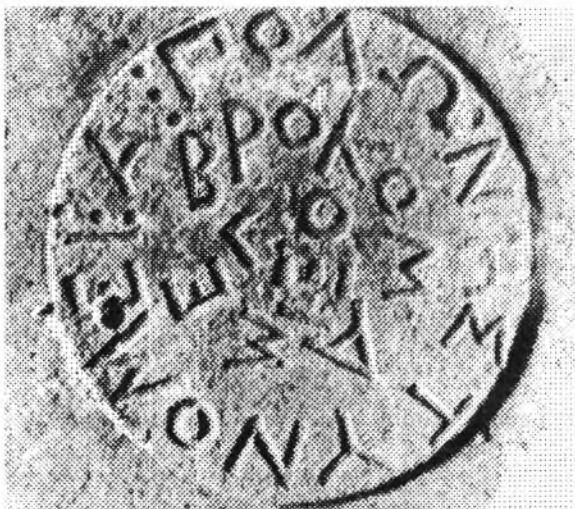
Рис. 3. Синопское клеймо Полона

клеймо с легендой по спирали по часовой стрелке (рис. 3): Πόλων ἡστυνόμεν Ἀβρόκομας ἐπόει 21 . Б.Н. Гракову было известно два синопских оттиска из собрания Государственного Исторического музея в Москве 22 . Позднее, помимо этих двух, в рукопись керамических клейм Синопы Б.Н. Граков включил еще два клейма из раскопок Ольвии в 1949 и 1955 гг. 23 Там же, в Ольвии, в 1964 г. обнаружено еще одно клеймо 24 . Таким образом, все известные пять оттисков черепичных клейм найдены в Ольвии.