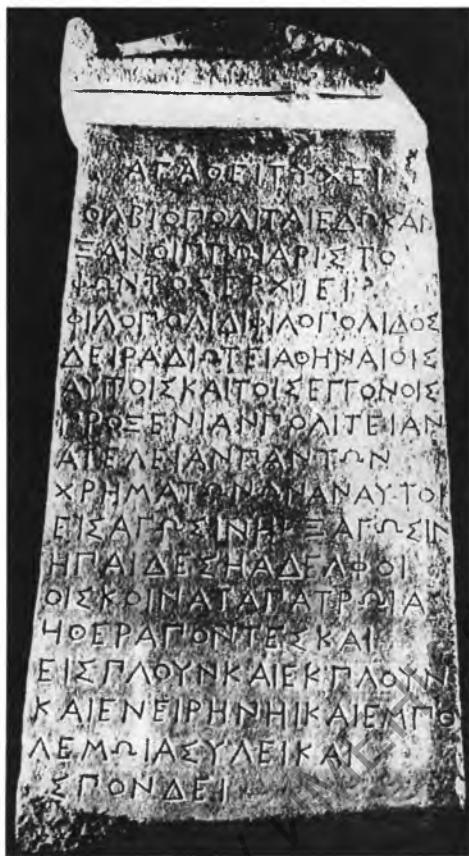
Рис. 2. Ольвийская проксения афинянам Ксантиппу и Филополиду. IV в. до н.э.

Мраморные стелы с вырезанными на них почетными декретами наряду со статуями и изображениями служили наградными памятниками (рис. 2). В заключительной части декретов часто говорится, что его текст следует вырезать на белокаменной стеле и установить в определенном месте, обычно там же, где находились статуи. В эллинистический период такое почетное пространство для стел в Ольвии было отведено у храма Аполлона (НО. № 29, 35, 36), а в Херсонесе – у храма и алтаря Девы (IOSPE I 2 . № 344; НЭПХ. № 2), т.е. на теменосах верховных богов государства. Есть одно упоминание о постановке стелы в помещении ольвийской коллегии Семи 42 , а в римское время – в ольвийском святилище Зевса (НО. № 45) и в херсонесском святилище Асклепия (IOSPE I 2 . № 376). В большинстве же надписей рекомендуется установить декрет на акрополе Херсонеса 43 , а в Ольвии – на самом видном и почетном месте города (IOSPE I 2 . № 40; НО. № 49).