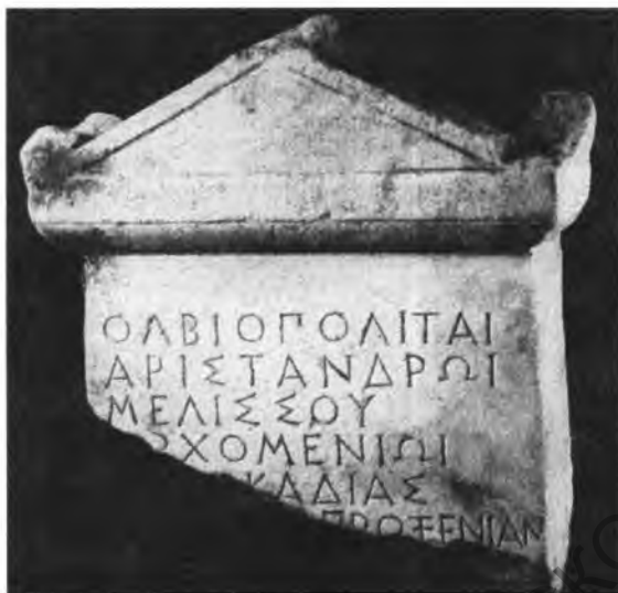
Рис. 3. Ольвийская проксения орхомену Аристандру

ти консулов нового времени 44 . Сравнение текстов проксений разных полисов показывает, что их составляли по строго определенным формулам, которые незначительно изменялись на протяжении многих веков. В римский период проксении постепенно утрачивали первоначальное значение и часто превращались в почетные титулы 45 . Обычно льготы, предоставлявшиеся проксениями, включали освобождение от налогов на ввозимые и вывозимые товары, а также освобождение от уплаты гаванных сборов. Часто проксен получал еще гражданство, уравнивавшее его во всех правах с полноправными жителями дружественного города. Иногда льготы распространялись на братьев и сыновей проксена, а торговыми преимуществами могли по его поручению пользоваться слуги 46 .