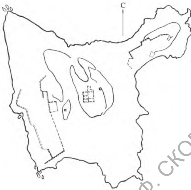
Рис. 1. План острова Левка и храма Ахилла на центральной возвышенности, снятый Н.Д. Критским

ное в общем-то скептическое отношение к открытым памятникам не способствовало тому, чтобы сразу же отправить на остров специалистов для проверки плана на местности. В итоге это привело к непоправимым последствиям и до сегодняшнего времени существуют сомнения относительно полной идентификации плана Н.Д. Критского с храмом Ахилла.