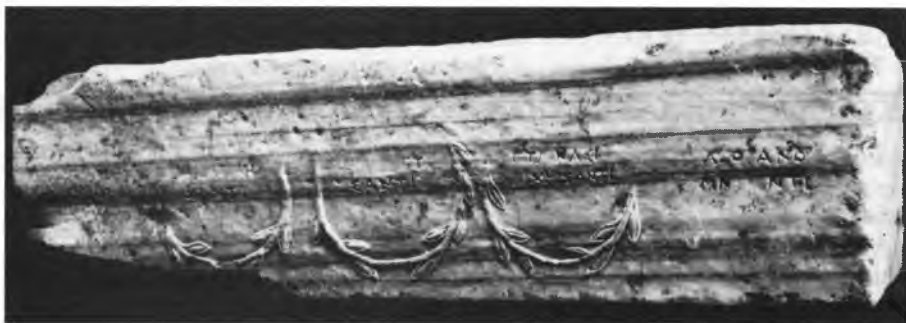
Рис. 1. Боковая грань постамента статуи Агасикла, сына Ктесия

270 г. до н.э. 3 Признавая весомость некоторых аргументов В.П. Яйленко, приведенных в пользу именно такой датировки, следует подчеркнуть, что они далеко не бесспорны и в лучшем случае свидетельствуют о возможности отнесения памятника лишь к началу или первым двум десятилетиям III в. до н.э. 4 Это, по сути, ничего не меняет, а лишь говорит об отсутствии еще в достаточной мере разработанной датировки шрифта ранних херсонесских надписей. К тому же, предложенная В.П. Яйленко дата памятника плохо согласуется с ситуацией, сложившейся в Херсонесе к 270 г. до н.э., что заставляет вслед за Ю.Г. Виноградовым отнести установку почетной надписи в честь Агасикла ко времени не позднее начала III в. до н.э.