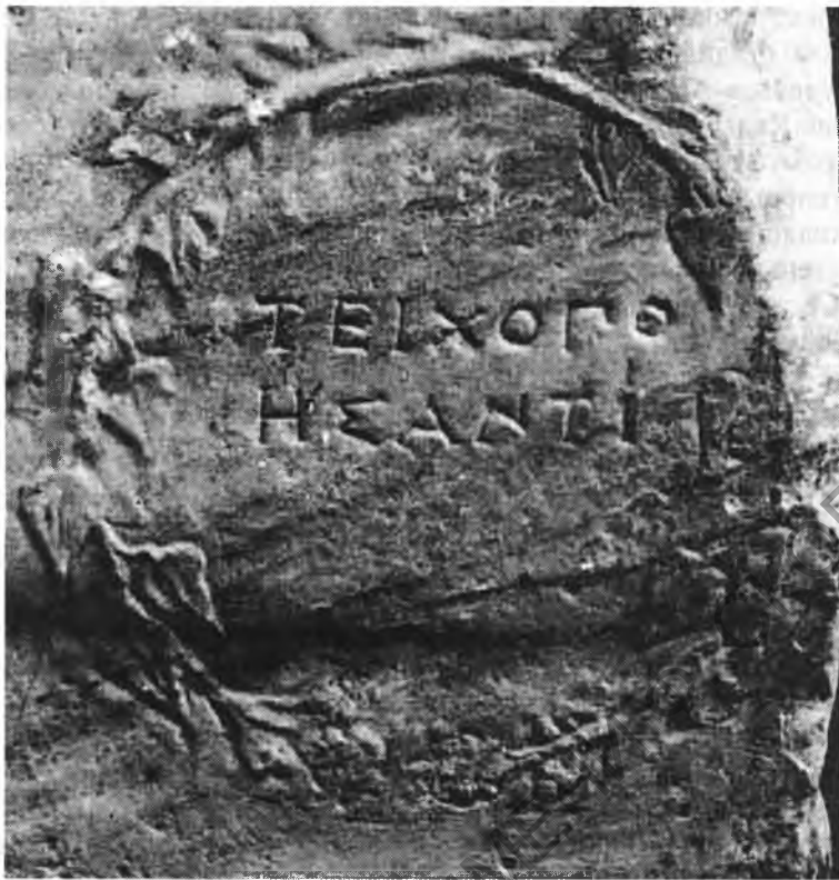
Рис. 4. Венок с надписью «бывшему стеностроителю» на лицевой стороне постамента

Однако и эту деятельность Агасикда также нельзя связывать исключительно с землями Херсонеса в Северо-Западной Таврике.