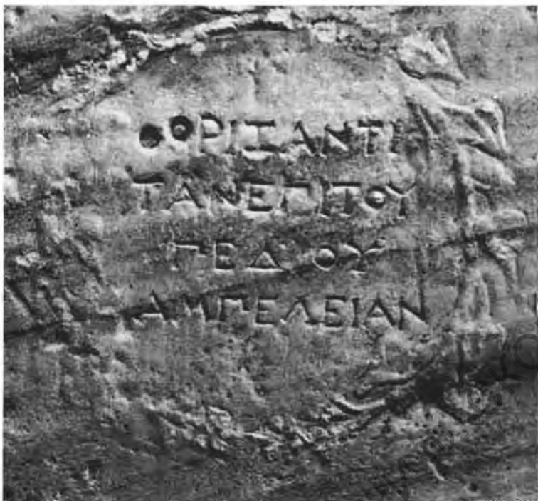
Рис. 3. Венок с упоминанием границы виноградной области или виноградников на «равнине» на лицевой стороне постамента

ред ΓΕΔΟΥ свидетельствует об идентичности «равнины» в этих эпиграфических документах 20 .