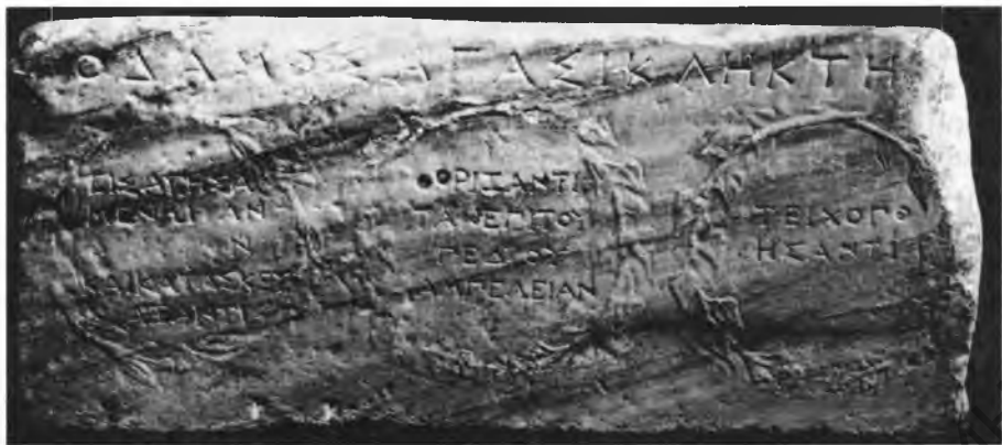
Рис. 2. Лицевая сторона постамента статуи Агасикла, сына Ктесия

Принимая поправки к прочтению заслуг Агасикла в венках на лицевой стороне постамента, предложенные Ю.Г. Виноградовым на основании аналогий, все же нельзя безоговорочно согласиться с его заключением, как, впрочем, и с мнением его главного оппонента 8 , что все перечисленные деяния чествуемого были совершены вдали от Херсонеса, на территории херсонесских владений в Северо-Западной Таврике. Упоминание в венках на боковой стороне постамента магистратур, отправлявшихся этим деятелем, вне всякого сомнения, было связано с Херсонесом. Поэтому логично предположить, что и на лицевой стороне были отмечены наиболее значимые заслуги чествуемого, проведенные в жизнь в непосредственной близости от полиса. Они не только затрагивали интересы подавляющего большинства членов гражданской общины, но и были им хорошо известны. Поэтому в венках, как на боковой, так и на лицевой стороне постамента, отсутствовали указания о том, где конкретно протекала деятельность Агасикла на благо гражданской общины. В противном случае в венках на лицевой стороне следовало бы ожидать определенных уточнений того, где именно находилась граница «виноградной области» или виноградников, располагались гарнизон и стена, возведенная Агасиклом. Такой логический вывод хорошо согласуется со всем тем, что сегодня известно из истории Херсонеса на рубеже IV–III вв. и в начале III в. до н.э.