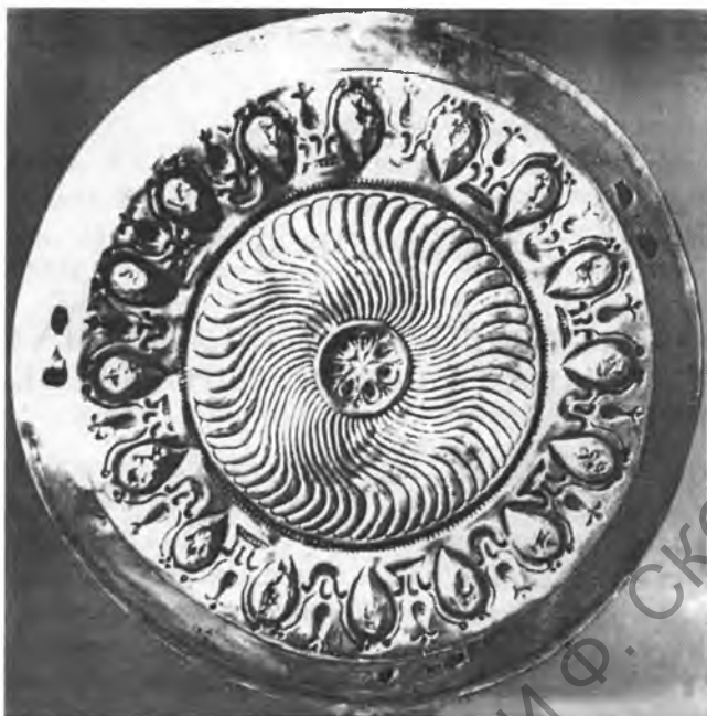
Рис. 1. Серебряный фиал № 1 с пуансонной надписью «Чаша Атромитра». В настоящее время хранится в Центральном музее Казахстана (Алма-Ата). Оренбург, 1916 г.