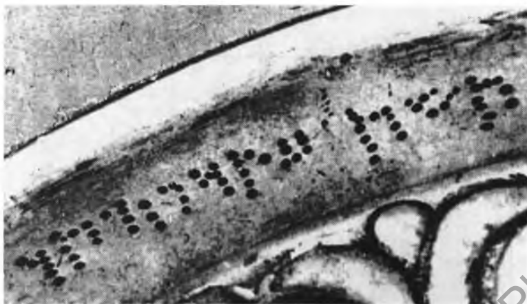
Рис. 3. Пуансонная надпись с фиала № 1. Оренбург, 1916 г.

ставляется мнѣ болѣе вѣроятной по соображеніямъ, основывающимся на метрологическихъ данныхъ элефантинскихъ папирусовъ. Позвольте разсчитывать на обещанныя Вами разъясненіе этого вопроса.