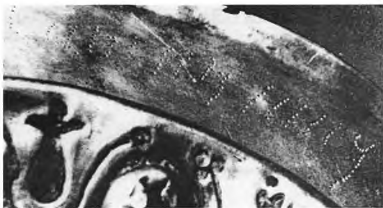
Рис. 4. Пуансонная надпись с фиала № 2. Оренбург, 1916 г.

го Эрмитажа, публиковавшейся неоднократно, последний раз и наиболее детально К.В. Тревер 30 . В этой надписи читаем: k 9 s 1 ZWZN 3 MN kryhw – «9 к<аршей>, с<татер> 1, драхм 3. Из (имущества) Кариахва(?)».