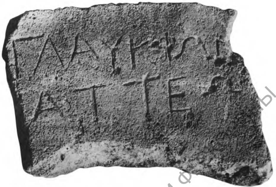
Рис. 2. Стела Главкиона, сына Аттеса (КБН 175) из Мирмекия

Вместе с КБН 175 (рис. 2): Γλαυκίων Ἰαττῶ, имя теперь во второй раз засвидетельствовано в Мирмекии (о месте находки камня см. КБН. С. 479. Прим.*) и еще трижды в других городах Боспора тоже в IV в. до н.э.: 209 (Пантикапей), 1056. I. 9 (Гермонасса), 1102 (Корокондама: Ἰαττῆς). Как и публикуемый памятник, эпитафия 175 датируется издателями КБН первой половиной IV в. Надпись выполнена в довольно архаичной манере (не по линейке, буквы относительно линии строки ведут себя очень свободно), сам шрифт, пожалуй, указывает на первые десятилетия IV в. Не был ли Главкион еще одним сыном Аттеса?