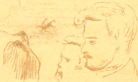
Автографъ 1840 г.

(писано карандашемъ, отъ времени стертися; уцѣлѣло, что неэтомъ было написано чернилами сверху карандаша).