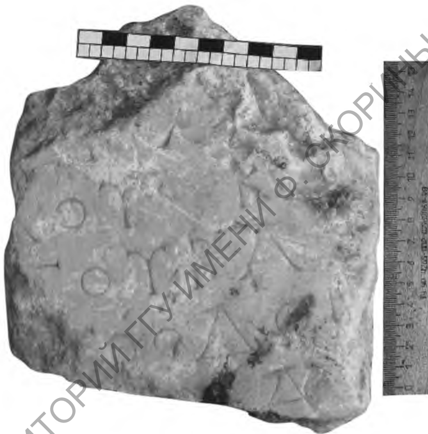
Рис. 1. Надпись царицы Пифодориды. Мрамор. Пантикапей.