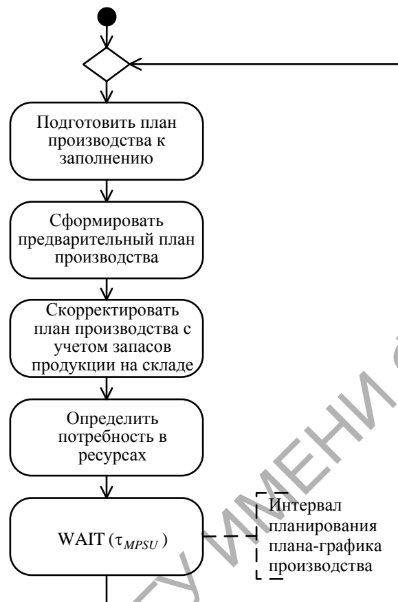
Рисунок 1 – Схема алгоритма процесса «Планирование производства»

ским и требуемым объемом незавершенного производства распределяется по периодам планирования. На величину избытка последовательно уменьшается планируемый запуск в ближайших периодах, начиная с текущего. В дальнейшем определяются потребности в ресурсах. Полагается, что все ресурсы должны быть в наличии на момент запуска в производство.