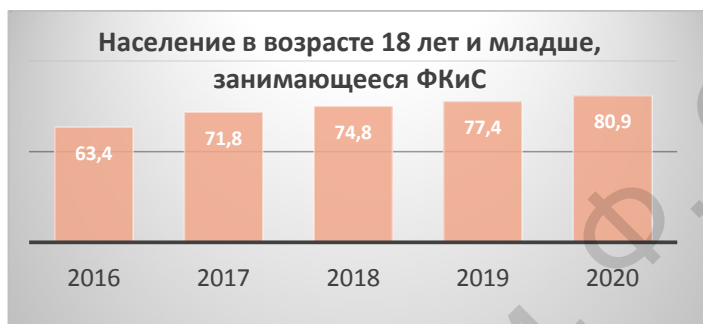
Рисунок 2 – Процент занимающихся ФК и С в Республике Беларусь в возрасте до 18 лет [18, 19]

Так численность людей, занимающихся ФКиС с 2014 по 2020 годы постоянно растет: с 1915,11 тыс. человек до 2 429,6 тыс. человек (прирост составляет 26,86%), а показатель отражающий численность занимающихся ФКиС, в % к общей численности населения вырос с 20,2 % до 25,9 % (прирост 5,7%).