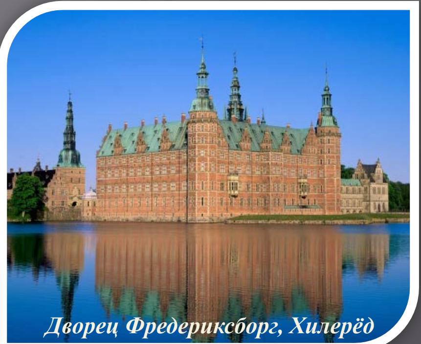
Дворец Фредериксборг, Хилерёд

Замок Фредериксборг (датск. Fredericksborg Slot) — замок (а точнее дворец), расположенный в городке Хилерёд (Hillerød) в Дании. Замок был построен для Короля Кристиана IV и в настоящее время известен как Музей Национальной Истории. С давних времен замок зарекомендовал себя как символ абсолютной монархии в Дании, монархии, которая до наших времен еще ни разу не прерывалась.