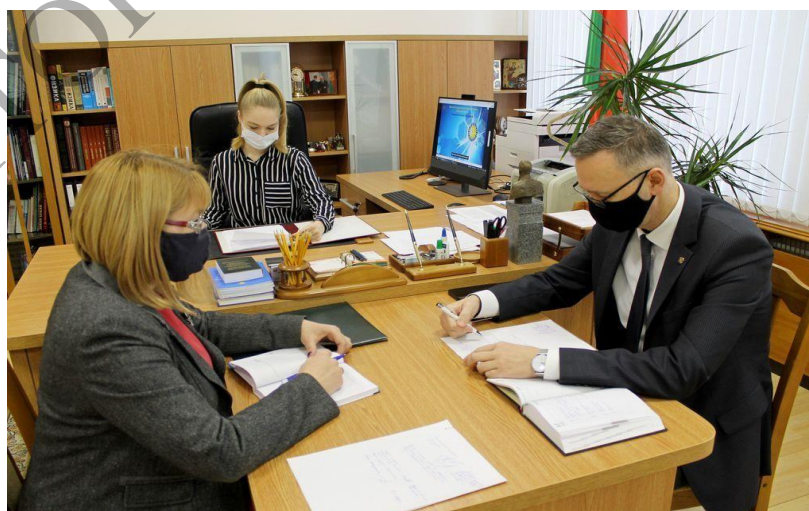
Рисунок 2 – День студенческого самоуправления

Члены Студенческого совета – активные участники общеуниверситетских, региональных и республиканских мероприятий, среди которых конкурс «Лучшая учебная группа», профориентационные встречи со школьниками на факультетских Днях открытых дверей, конкурс «Студент года», волонтерские акции и мероприятия, посвященные Всемирному дню студента. В рамках этих мероприятий в ГГУ имени Ф. Скорины прошла «Студенческая неделя 2021». Ключевым событием в праздничной неделе стал день студенческого самоуправления. Традиционно в этот праздник лучшие представители студенчества на один день становятся преподавателями, проректорами и даже ректором (см. рисунок 2).