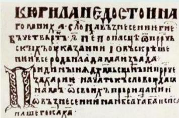
Первая страница "Слова" Кирилла Туровского

Выдающийся писатель и оратор. Писал "Слова" - обращения к верующим, молитвы, повести-притчи. Стал туровским епископом в 1169 г.