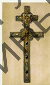
Крест Евфросинии Полоцкой