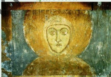
Фреска XII в. из Спасской церкви в Полоцке

Основала женский и мужской монастыри. По ее инициативе построены церкви - Спасская и Святой Богородицы, сделан крест в 1161 г.