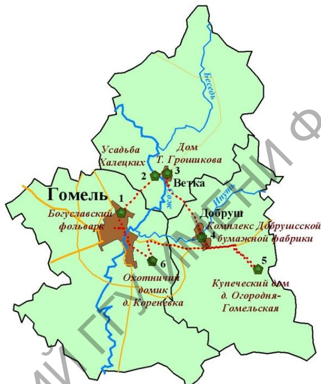
Рисунок 1 – Экскурсионно-познавательный маршрут «Старинные усадебные комплексы Гомельского Посожья»