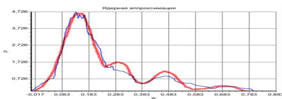
Рисунок 2 - Оценка эмпирического распределения отношений (R) концентраций АсІNH и ІNH теоретической смесью из четырех нормальных распределений