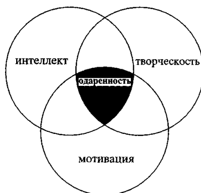
Рисунок 1 – Модель одаренности Дж. Рензулли.

Результаты и их обсуждение. Модель Дж. Рензулли (рисунок 1) включает три рода переменных, символизируемых тремя пересекающимися кругами: интеллект выше среднего, усиленную мотивацию и «творческую». Пересечение кругов подчеркивает необходимость взаимодействия всех трех составляющих одаренности для достижения высокой результативности деятельности.